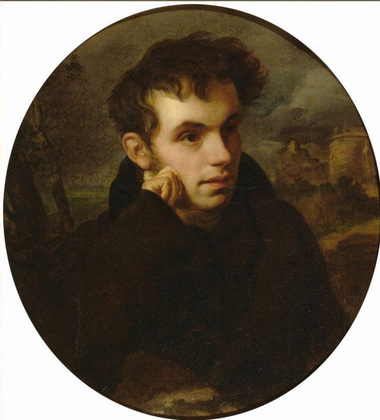
В. А. Жуковский

Началом литературной деятельности В. А. Жуковского стало «Сельское кладбище» (1802), перевод в 1801 г. элегии английского поэта Т. Грея. Элегия принесла В. А. Жуковскому успех у читателей и широкую известность.