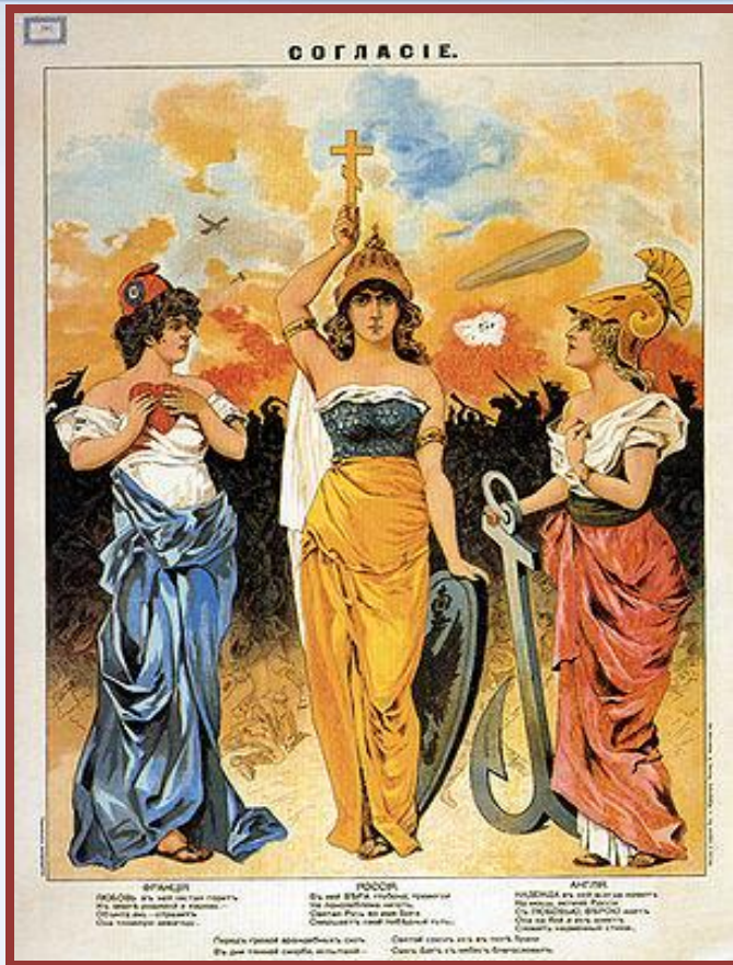
Аллегорическое изображение Антанты

Рубеж XIX-XX вв. – Тройственный союз и Антанта. Тройственный союз – Германия, Австро-Венгрия, Италия.