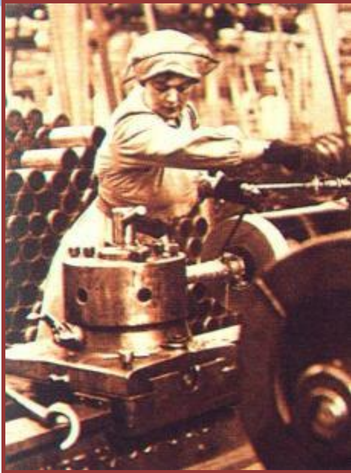
Военный завод в Англии

Экономика воюющих стран перешла на выпуск военной продукции. Снабжение населения осуществлялось по карточкам.