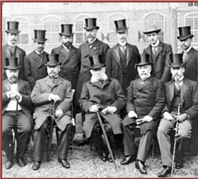
Участники Гаагской конференции

Рубеж XIX-XX вв. – индустриализация, борьба за рынки – передел мира. США, Германия, Италия, Япония – «неуспевшие» страны – войны или «торговля» (Германия у Франции Конго в результате марокканского кризиса (1911 г.))