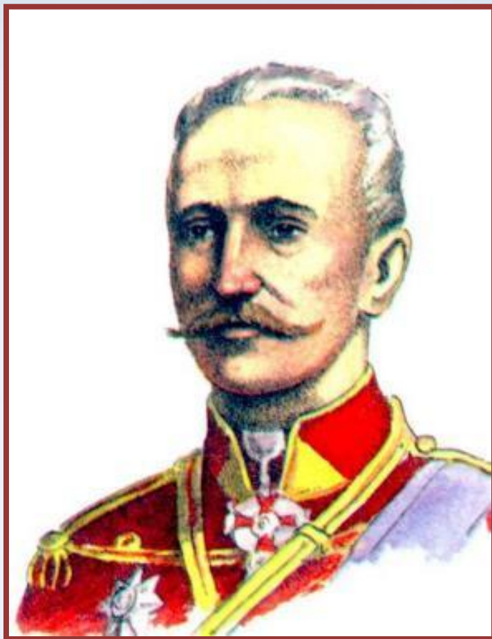
Русский генерал А.А.Брусилов

Летом 1916 г. в войне наметился перелом - Германия стала испытывать недостаток ресурсов. Антанта предприняла одновременное наступление на Западе и на Востоке. В результате Брусиловского прорыва Австро-Венгрия оказалась на грани катастрофы. В к. 1916 - н. 17 гг. к Антанте присоединились Греция и Румыния.