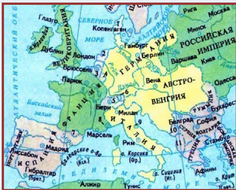
Военно-политические блоки в начале 20 века

Россия, союзница Сербии, начала мобилизацию. 1 августа Германия объявила ей войну, а 3 августа - Англии и Франции.