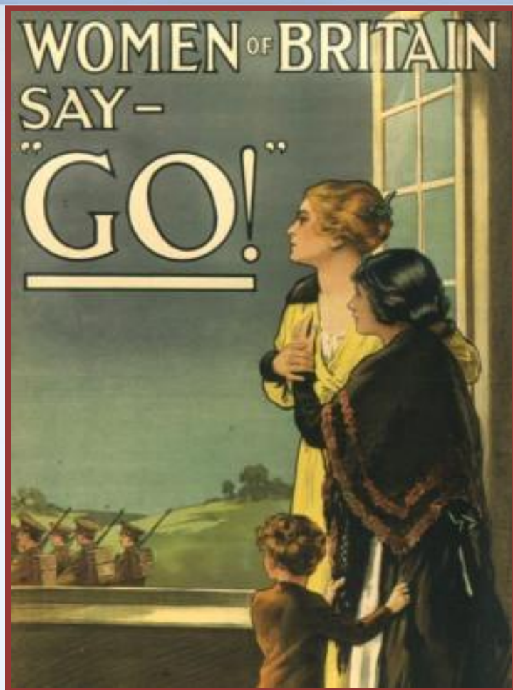
английский плакат 1915 года

Начало войны – Усиление государственного контроля, особые полномочия правительств, ограничение прав парламентариев, запрещение национальных партий, цензура. Государственное регулирование производства – государственно–монополистический капитализм – союз государства и крупных монополий в обеспечении военных заказов.