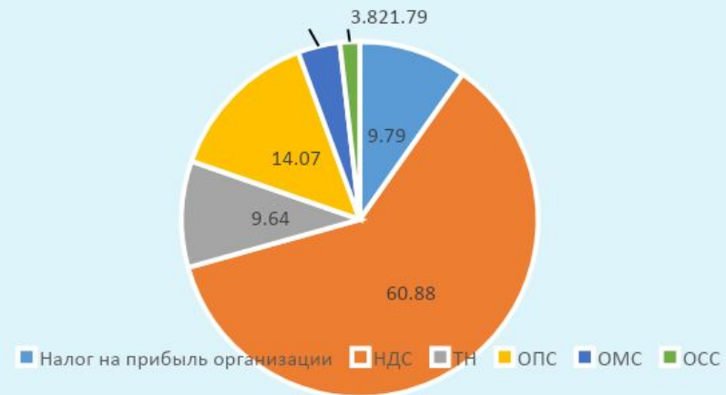
Доля в % за 2021 год