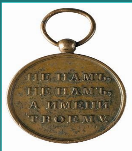
Медаль в память Отечественной войны 1812

Сам император, бросив войска бежал в Париж. Вернувшись во Францию он заявил: «Армии больше нет».