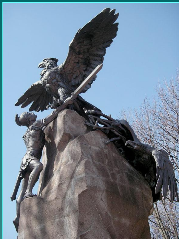
Памятник героям Отечественной войны 1812 г.

Отечественная война 1812 г.— величайшее событие в русской истории. В ее ходе ярко проявились героизм, мужество, патриотизм и беззаветная любовь всех слоев общества и особенно простых людей к своей Родине.