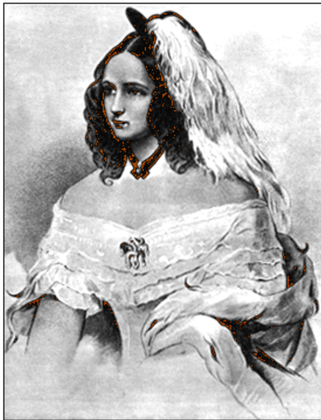
С портрета В. Жау