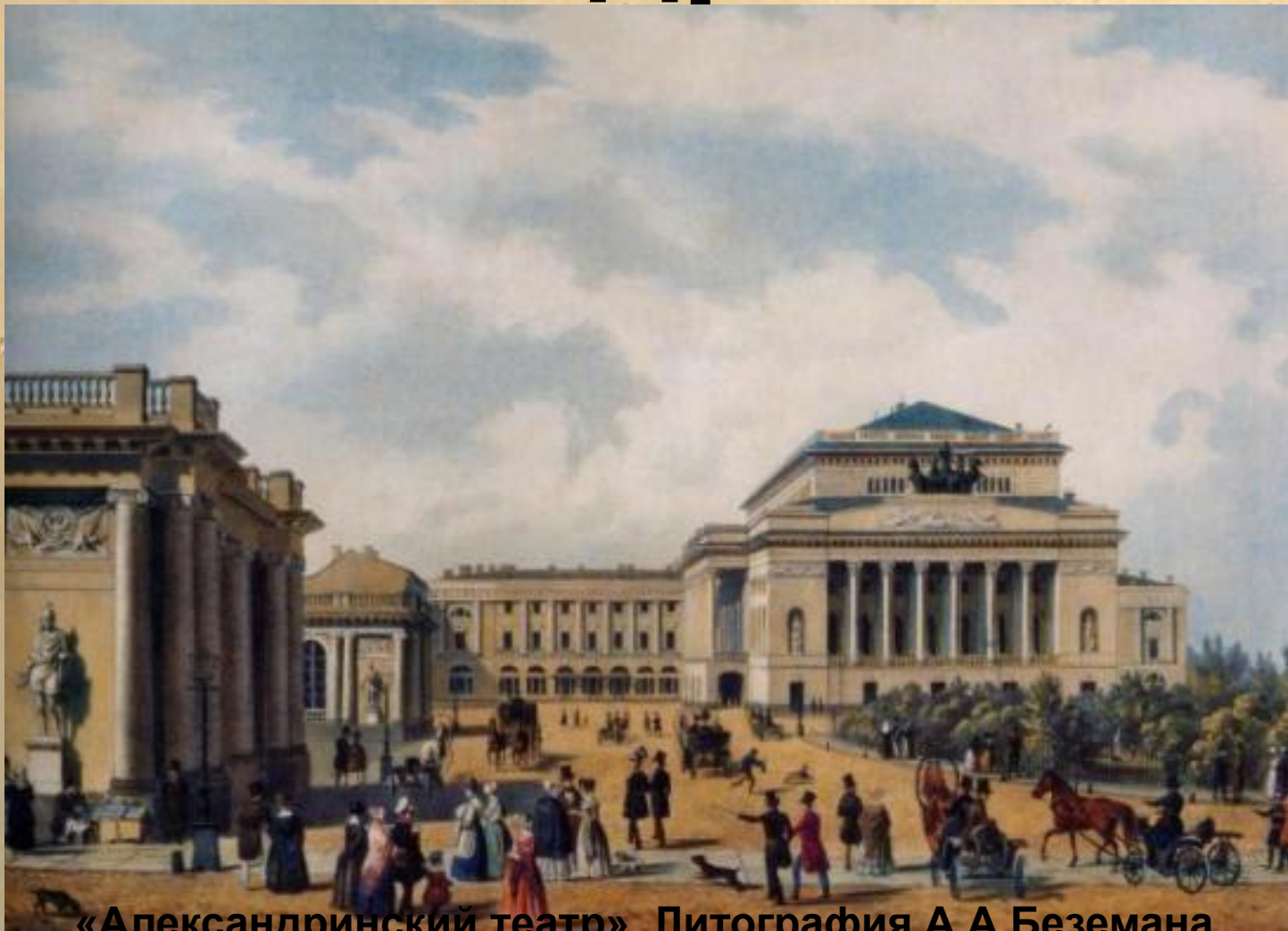
«Александринский театр». Литография А.А.Беземана