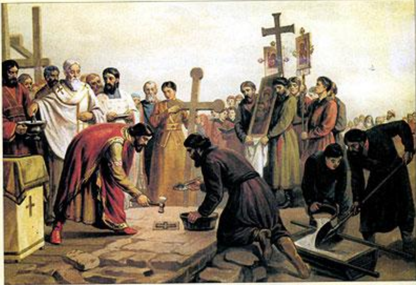
Закладка первого десятинного храма в Киеве