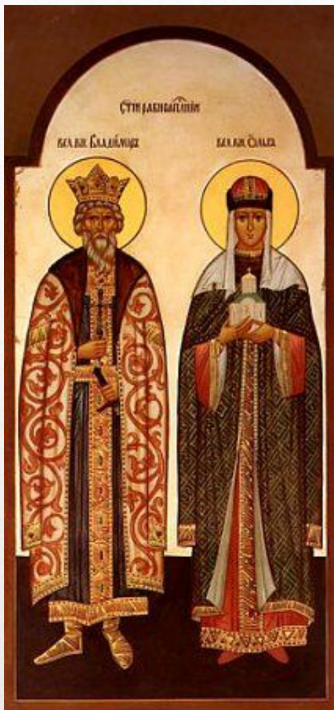
Равноапостольные князь Владимир и княгиня Ольга

. Владимир был внук святой равноапостольной Ольги, сын Святослава († 972). Мать его, Малуша († 1001) - дочь Малка Любечанина, которого историки отождествляют с Малом, князем Древлянским. Приводя к покорности восставших древлян и овладев их городами, княгиня Ольга повелела казнить князя Мала, за которого пытались ее сватать после убийства Игоря, а детей его, Добрыню и Малушу, взяла с собой. Добрыня вырос храбрым умелым воином, обладал государственным умом, был впоследствии хорошим помощником своему племяннику Владимиру в делах военного и государственного управления .