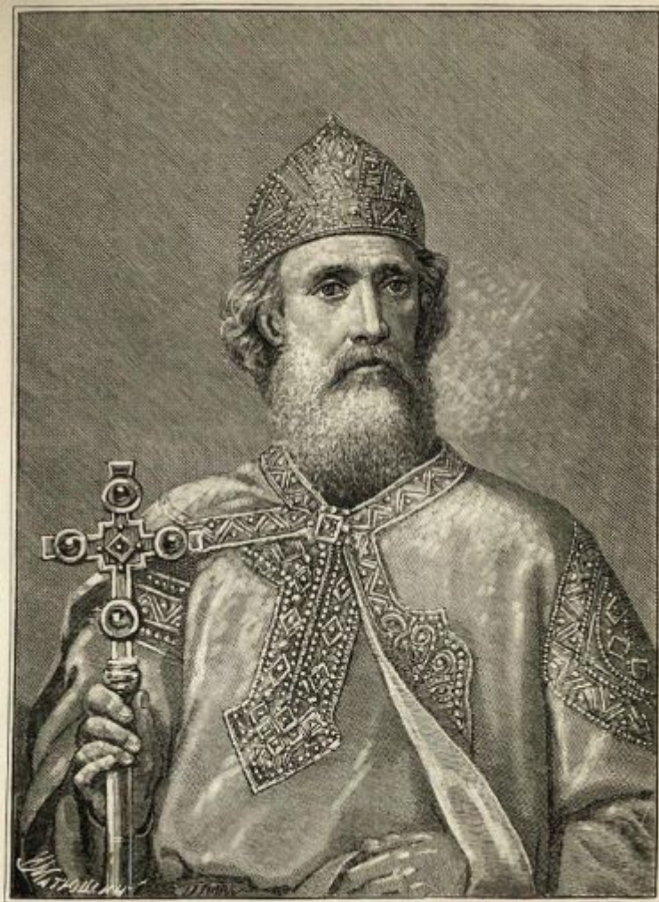
Владимир I, он же Владимир Святославович, великий креститель земли русской

. В некоторых греческих источниках святой Владимир именуется с того времени "могущественным басилевсом", он чеканит монеты по византийским образцам и изображается на них со знаками императорской власти: в царской одежде, на голове - императорская корона, в правой руке - скипетр с крестом. С царевной прибыл посвященный святым Патриархом Николаем II Хризостомом на Русскую кафедру митрополит Михаил со свитой, клиром, многими святыми мощами и другими святынями. В древнем Херсонесе, где каждый камень помнил святого Андрея Первозванного, свершилось венчание святого равноапостольного Владимира и блаженной Анны, напомнив и подтвердив исконное единство благовестия Христова на Руси.