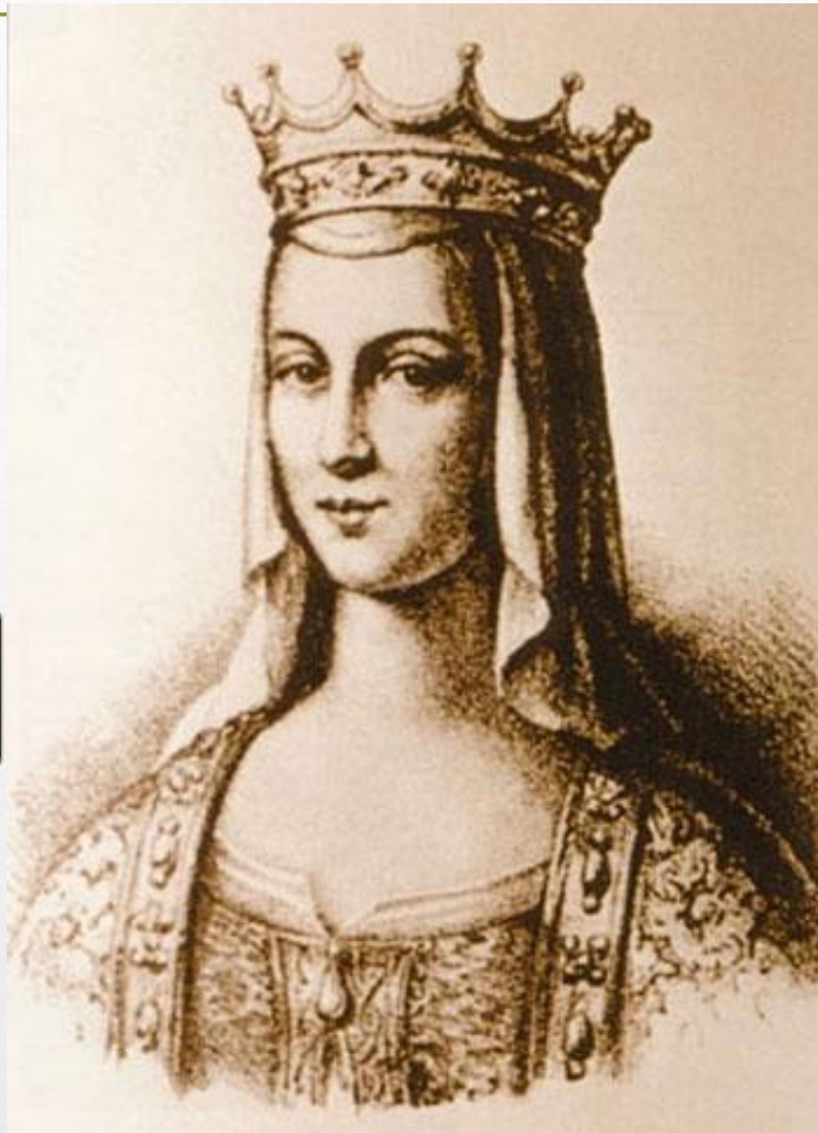
Анна, жена киевского князя Владимира Святого