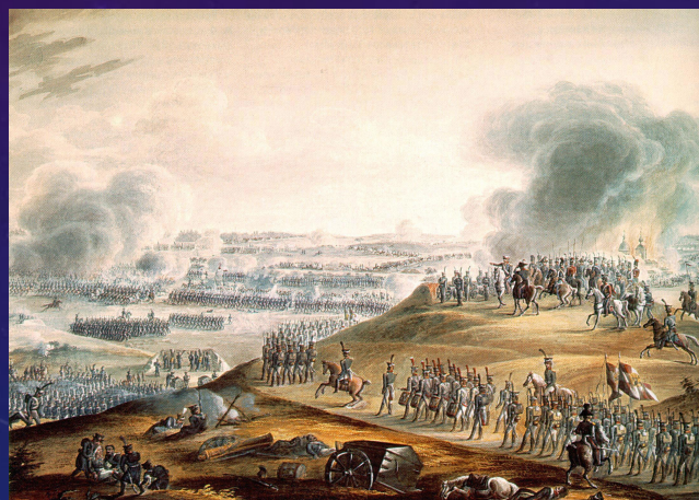
Бородинская битва (1812 год)