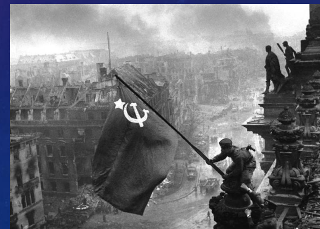
Взятие Берлина (1945 год)