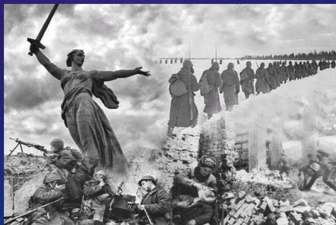
Сталинградская битва 1942-1943