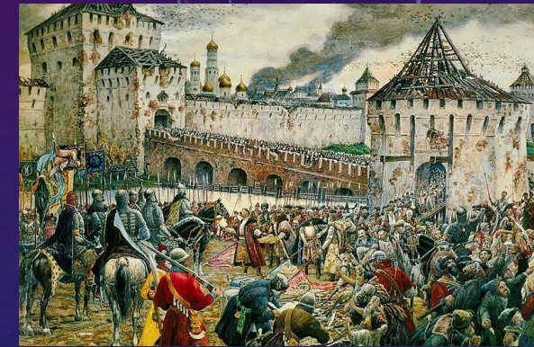
Московская битва (1612)