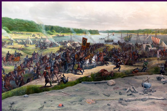
Невская Битва (1240 год)