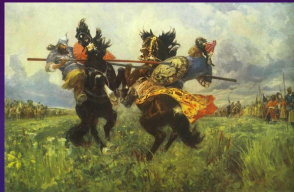
Куликовская битва (1380 год)