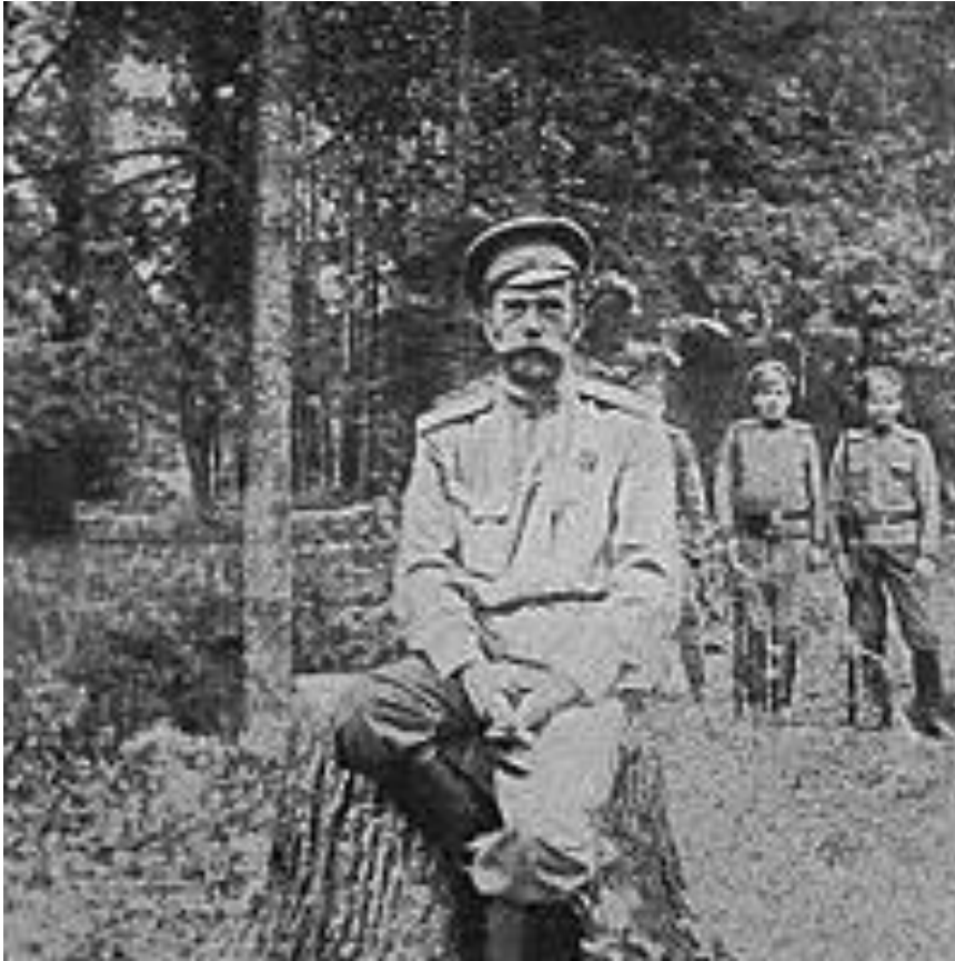
Фотография Николая 2, сделанная после его отречения

2 марта 1917 года Николай II подписал текст отречения от престола.