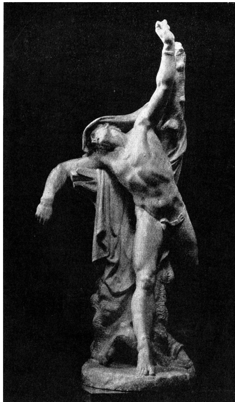
Поликрат. М.И. Козловский, 1790 г. Русский музей. Классицизм