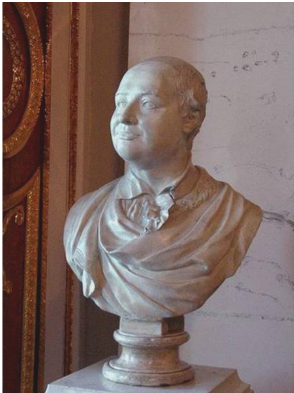
Портрет М.В. Ломоносова. Ф.И. Шубин, 1792 г. Классицизм, реализм

В отличие от других, эта Шубинская работа композиционно проста. В трактовке формы нет никаких элементов парадности и официозности. Портрет насыщен глубокой интеллектуальностью и демократизмом. В нем явно видны черты реалистической стилистики.