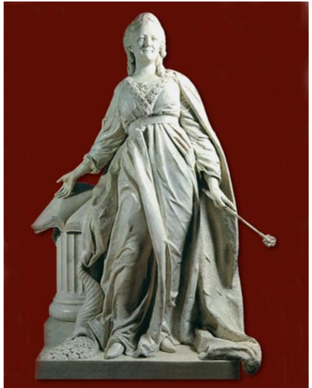
Екатерина II — законодательница. Ф.И. Шубин, 1789-1790 гг. Классицизм

Монархиня изображена в образе Минервы — римской богини мудрости, покровительницы наук, искусства и ремесел.