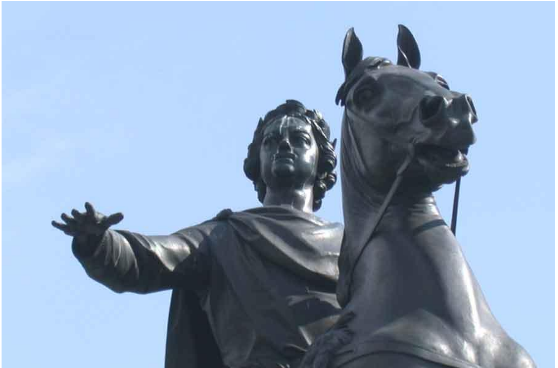
Памятник Петру I на Сенатской площади в Санкт-Петербурге. Фрагмент. Э. М. Фальконе, 1762—1782 гг. Классицизм