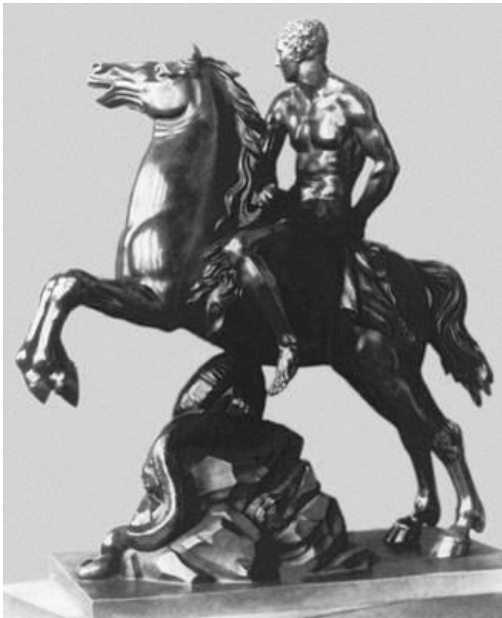
Геркулес на коне. М.И. Козловский, 1799 г. Русский музей. Классицизм