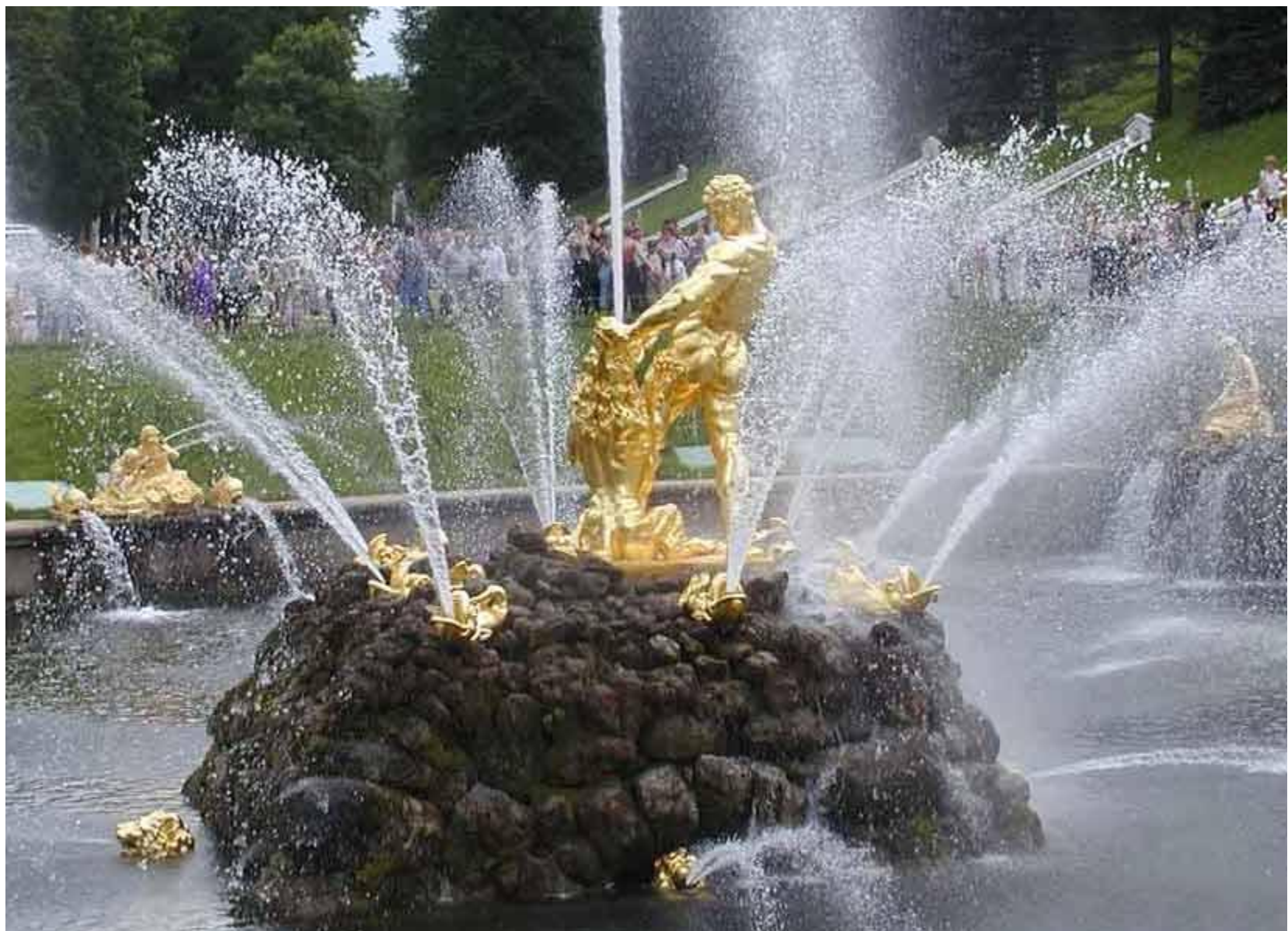
Самсон, раздирающий пасть льва. Фонтан в Петергофе. М.И. Козловский, 1800-1802 гг.