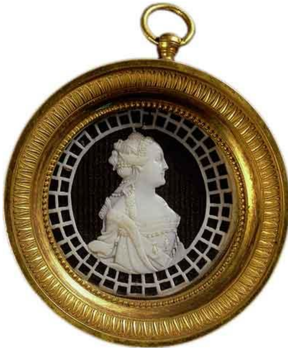
Портрет Екатерины II. 1780-е годы. Кость. Холмогоры