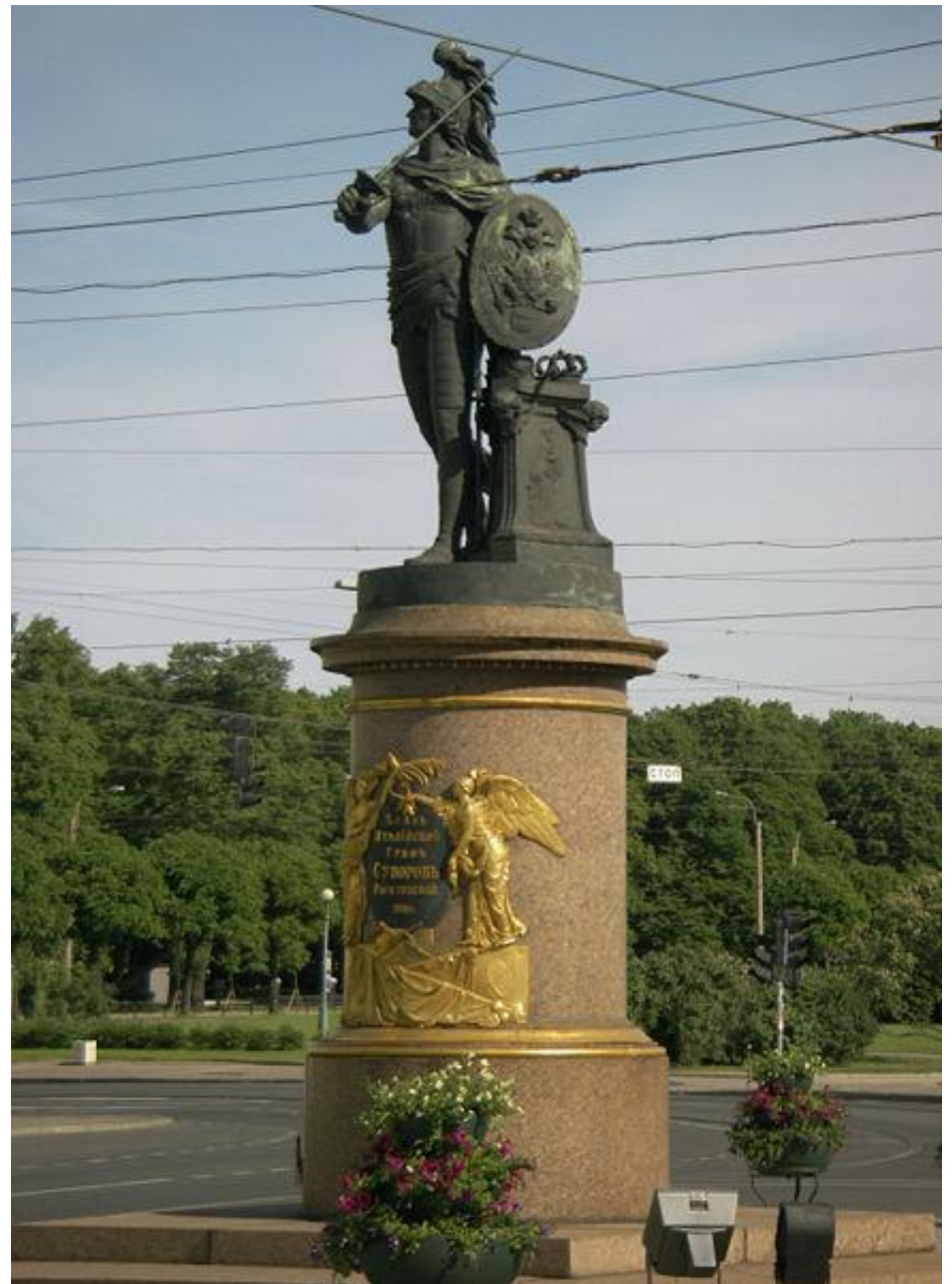
Памятник Суворову на Суворовской площади в Санкт-Петербурге. М.И. Козловский. Классицизм

«Аполлон», «Юпитер с Ганимедом», «Бодрствование Александра македонского»