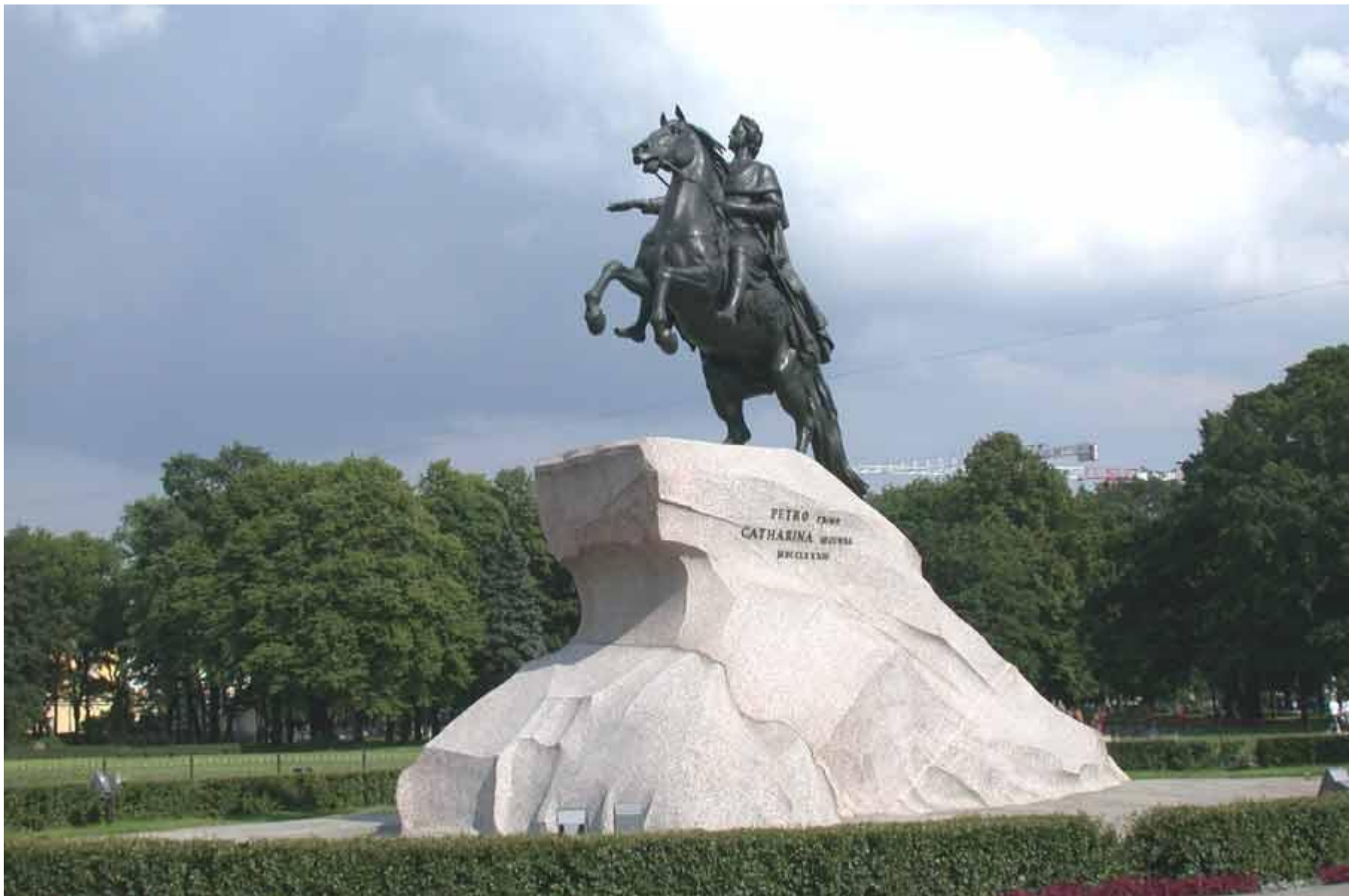
Памятник Петру I на Сенатской площади в Санкт-Петербурге. Вид с северо-западной стороны. Э.М. Фальконе, 1762—1782 гг. Классицизм