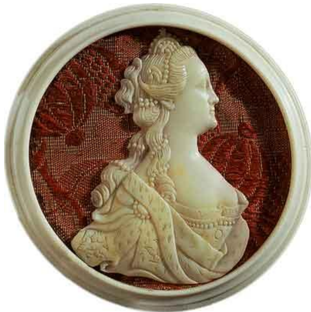
Портрет Екатерины II. 1780-е годы. Кость. Холмогоры