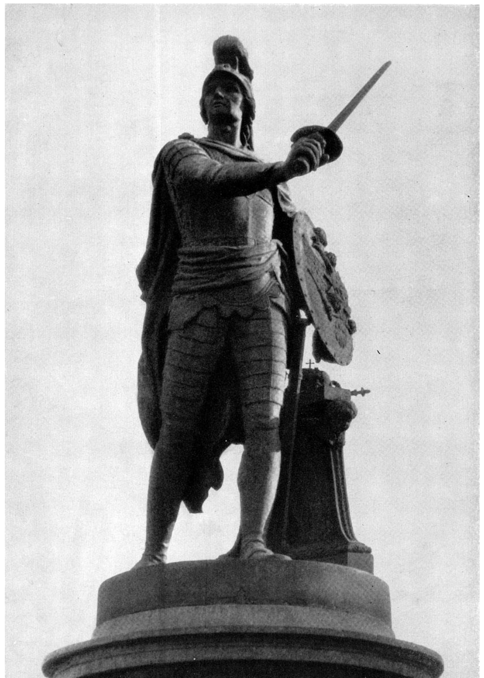
Памятник Суворову на Суворовской площади в Санкт-Петербурге. Фрагмент. М.И.Козловский. Классицизм

Памятник А.В. Суворову - изображен в образе античного героя, с доспехами, со щитом и мечом в руках.