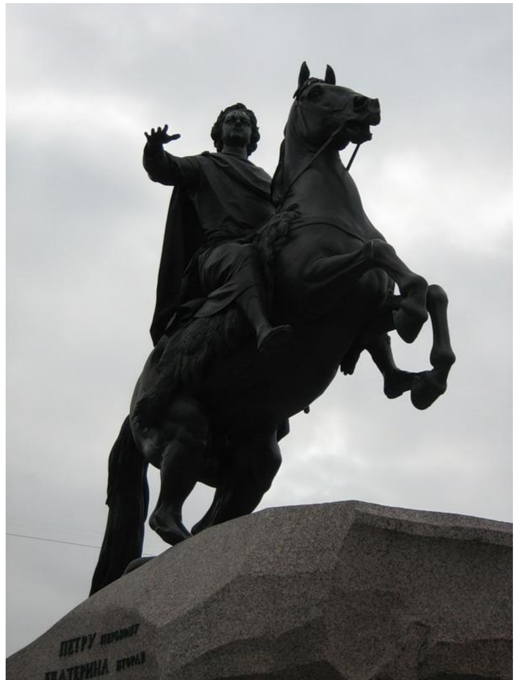
Медный всадник. Э.М. Фальконе, 1782 г.

Петр I показан законодателем и преобразователем России. Петр I изображен на вздыбившемся коне над дикой скалой, послужившей пьедесталом для конной статуи. Скульптор передает неудержимо-стремительное движение всадника, огромную утверждающую силу его жеста.