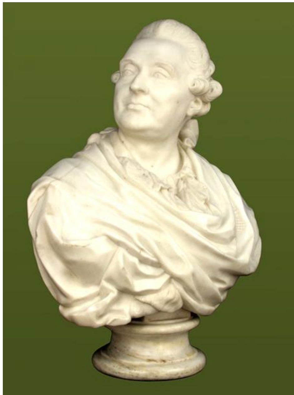
Портрет князя А.М. Голицына. Ф.И. Шубин, 1773г. Классицизм