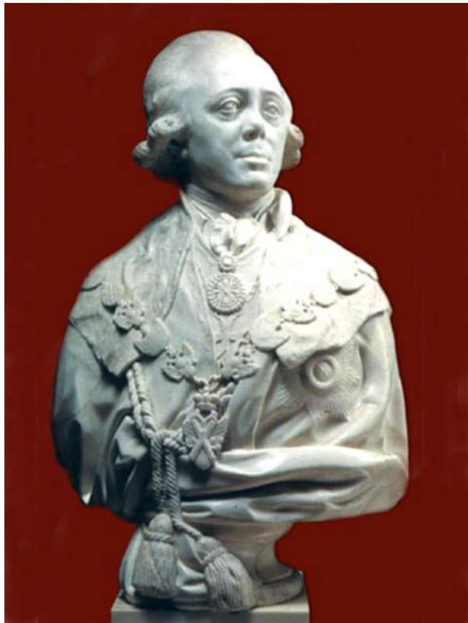
Портрет Павла I. Ф.И. Шубин, 1800 г. Классицизм

Портрет, выполненный в парадном жанре, по традиции изобилует звездами, орденами и прочими знаками отличия. Однако Шубин, что намного важнее, всегда цепко схватывал неповторимые особенности внешнего облика человека, стремясь выразить его духовные свойства. Скульптор раскрывает в Павле I сложность его характера: надменность, холодную гордость, болезненное самолюбие и вместе с тем скрытое страдание и незащищенность его «Я».