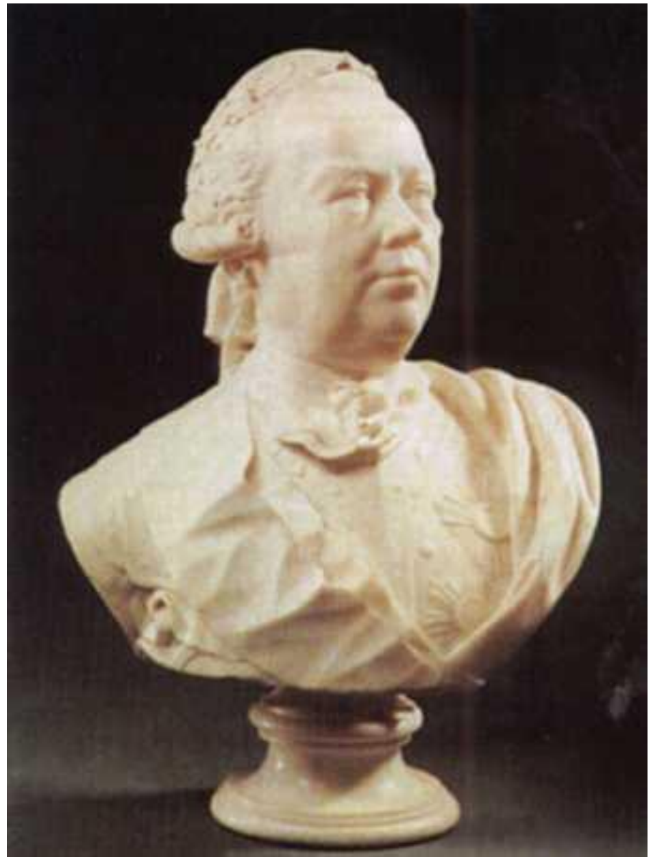
Генерал -фельдмаршал граф П. А. Румянцев-Задунайский. Ф.И.Шубин, 1778 г. Мрамор. Классицизм