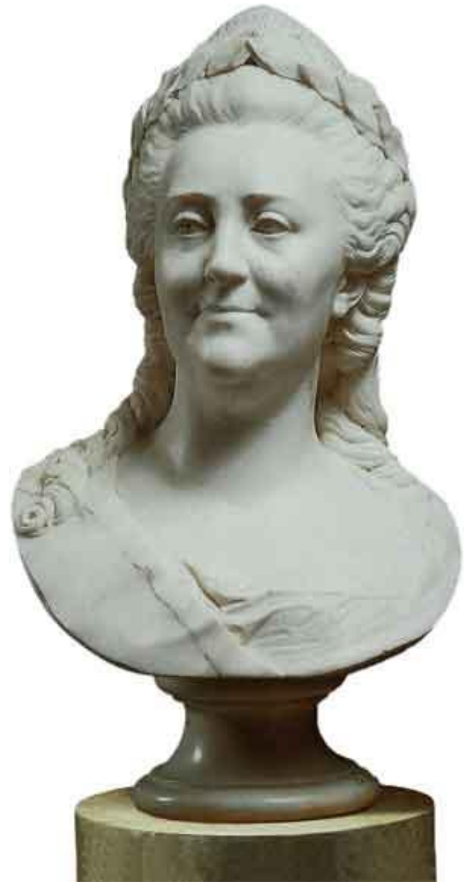
Портрет Екатерины II. Ф.И. Шубин, 1791 г. Мрамор. Классицизм