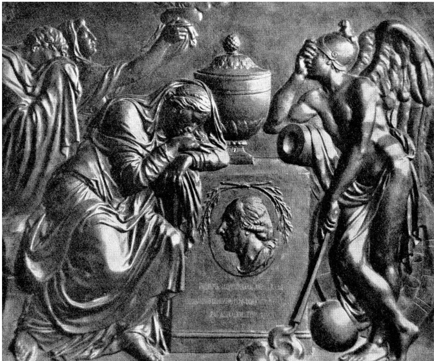
Надгробие П.И. Мелиссино. Бронза. М. И. Козловский, 1800 г. Санкт-Петербург, Некрополь бывш. Александро-Невской лавры