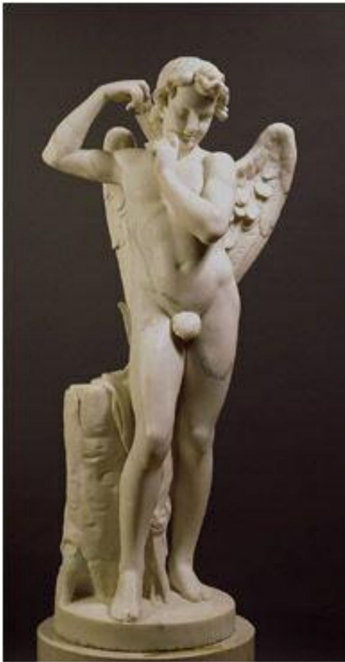
Амур со стрелой. М.И. Козловский, 1797 г. Классицизм