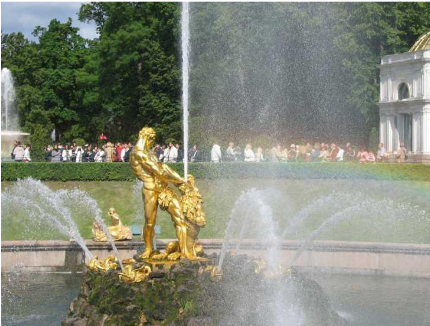
Самсон, раздирающий пасть льва. Фонтан в Петергофе. М.И. Козловский, 1800-1802 гг.