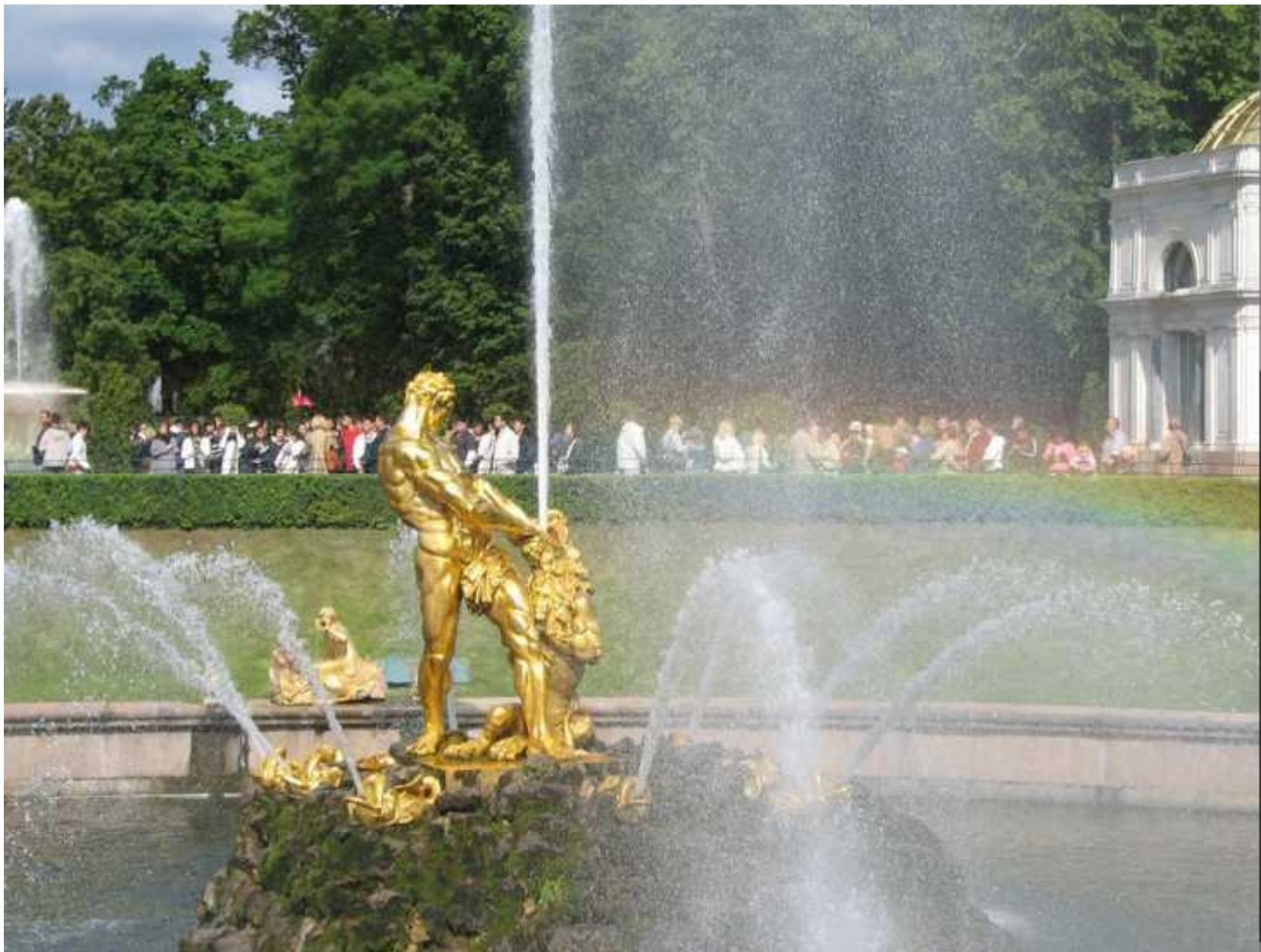
Самсон, раздирающий пасть льва. Фонтан в Петергофе. М.И. Козловский, 1800-1802 гг.