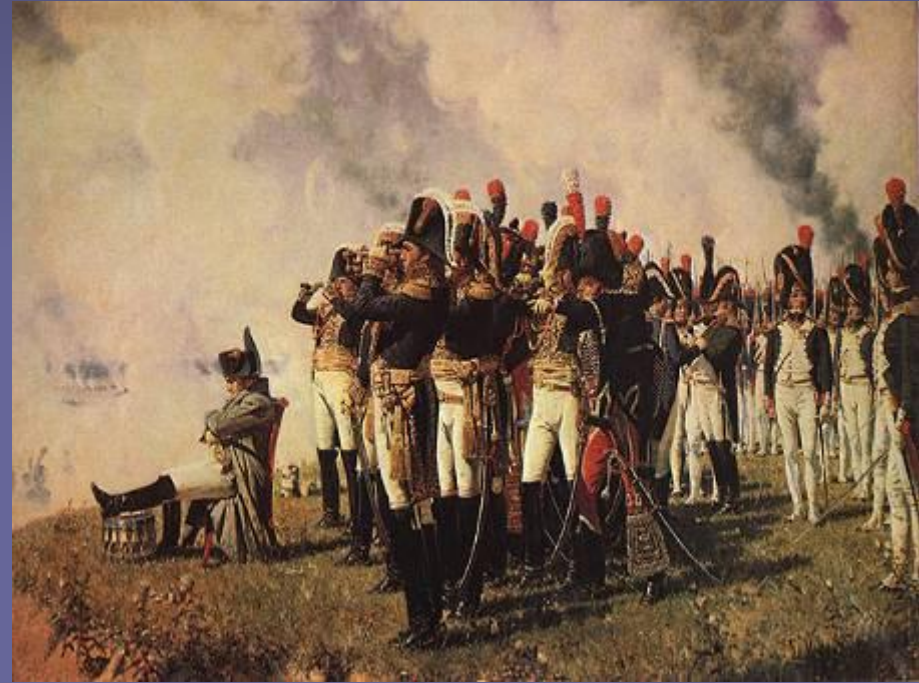
Наполеон I на Бородинских высотах