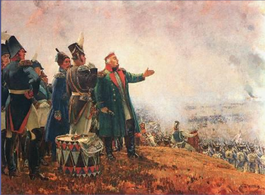
С. Герасимов. «Кутузов под Бородином»