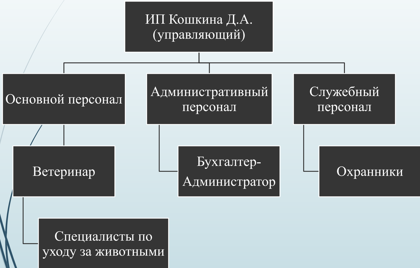
Схема организационной структуры организации.