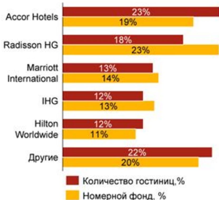
Распределение долей международных гостиничных операторов в РФ, 2019 г., %