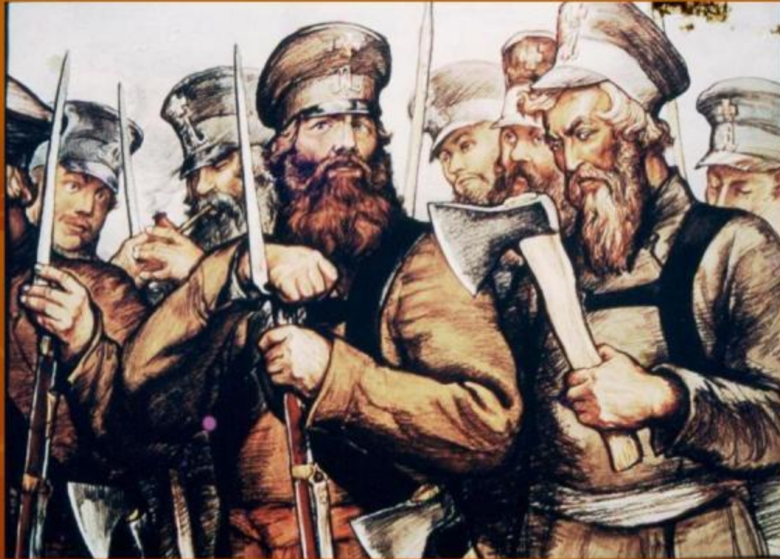
Ополченцы в 1812 г. Художник И. Архипов