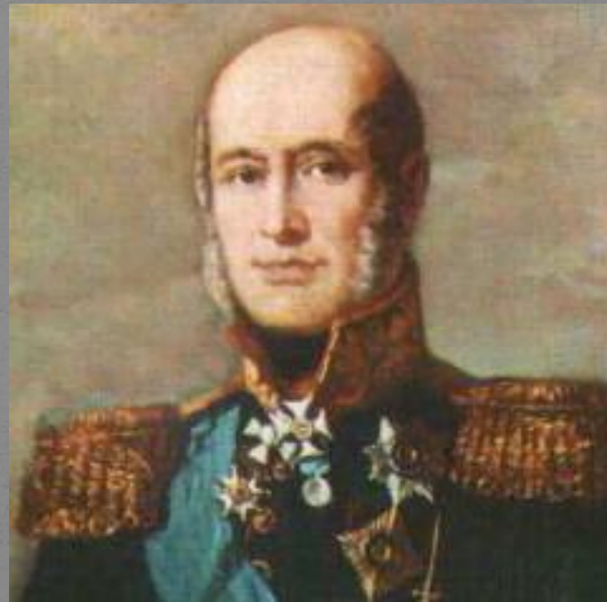
М.Б. Барклай де Толли

Военный министр, командующий русской армией в начале войны.