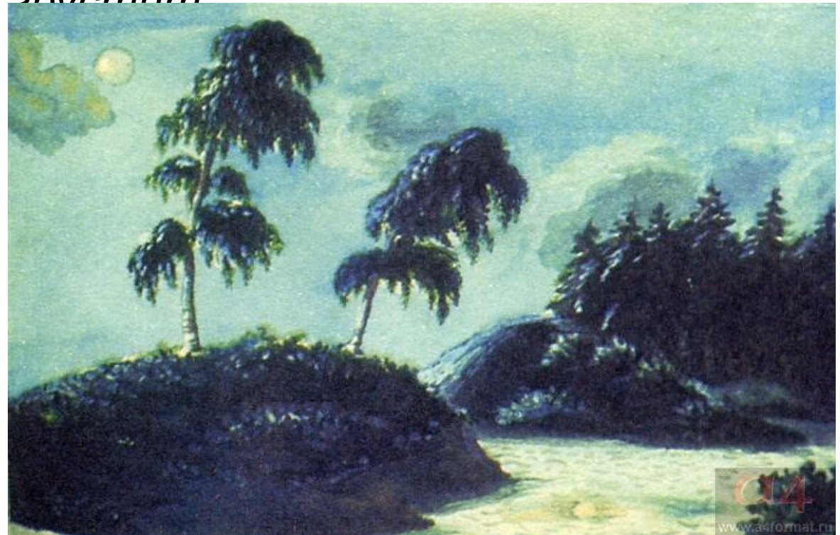
М.Ю. Лермонтов. Пейзаж с двумя березами. Акварель 1828–1832

Сон видит лирический герой, лежащий под палящим солнцем «в долине Дагестана»: ему снится «вечерний пир в родимой стороне», «юные жены, увенчанные цветами», весело говорящие о нём, и та единственная, которая задумчиво зрится