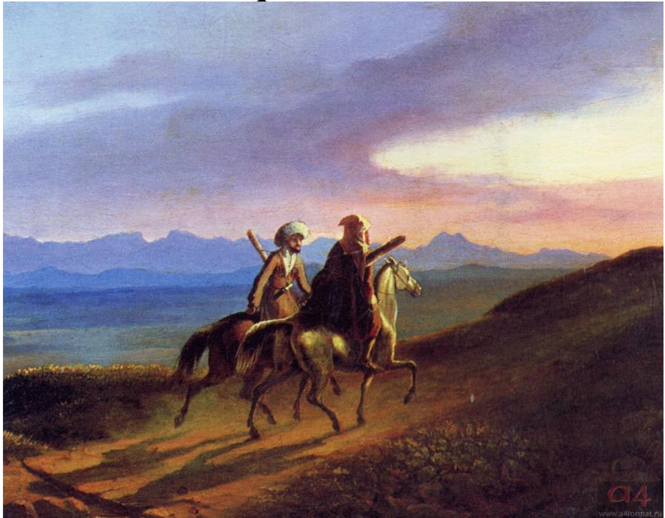
М.Ю. Лермонтов. Воспоминание о Кавказе. Масло. 1838