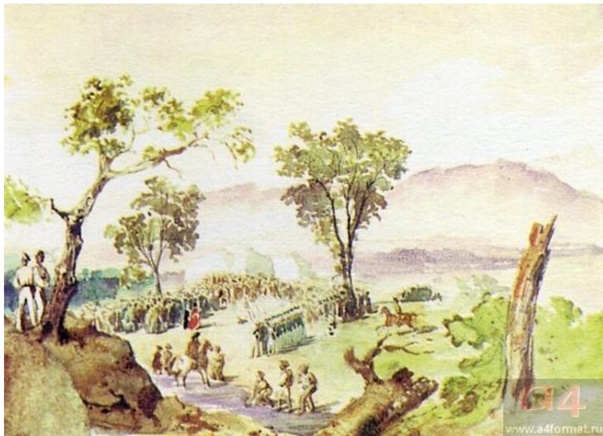
М.Ю. Лермонтов. При Валерике. Похороны убитых. Акварель. 1840

В чём драматизм стихотворения? Что, с вашей точки зрения, привело лирического героя к трагическому исходу?