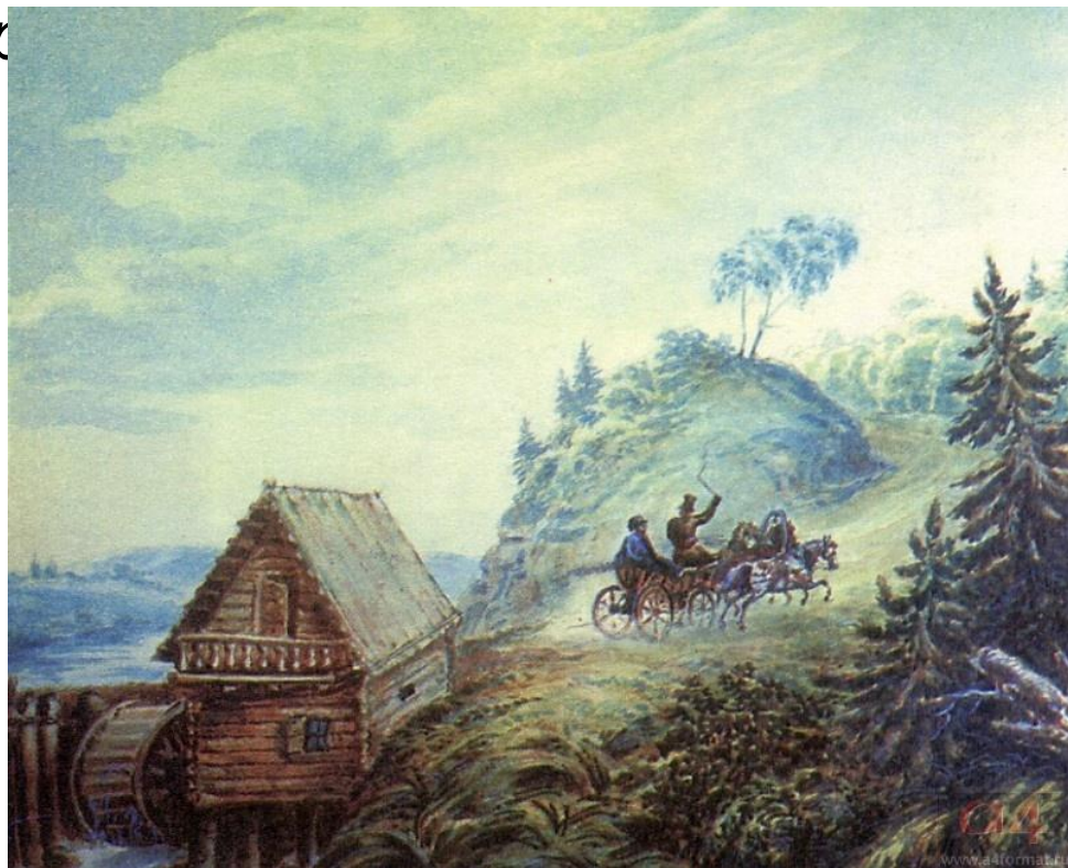
М.Ю. Лермонтов. Пейзаж с мельницей и скачущей тройкой. Масло. 1835