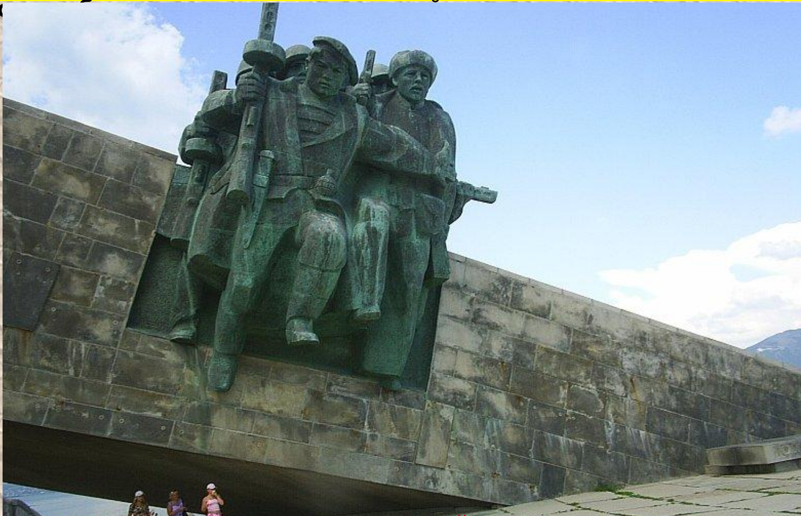
Фрагмент памятника десанту на МАЛОЙ ЗЕМЛЕ

Во время Великой Отечественной войны летом 1942 года гитлеровцы предприняли решительный бросок на юг, стремясь выйти к Волге и захватить Кавказ. 225 дней длился героическая эпос Малой земли. В результате боевых действий десантной группы войск в период с 4 по 30 апреля 1943 г. было уничтожено более 20 тысяч вражеских солдат и офицеров, захвачено и уничтожено