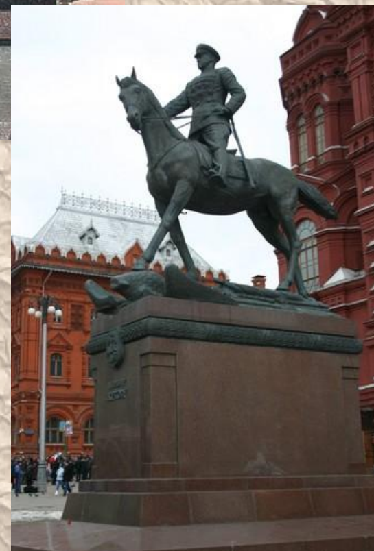
Памятник Г.К. Жукову