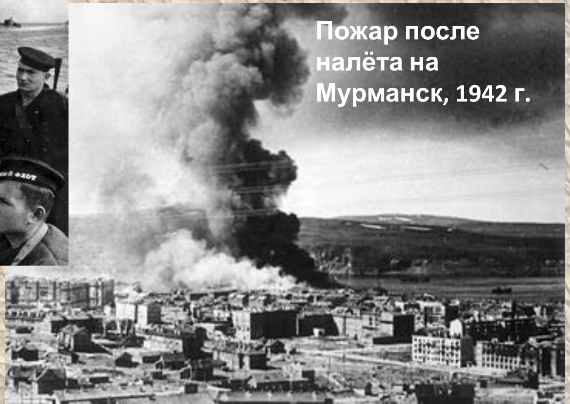
Пожар после налёта на Мурманск, 1942 г.