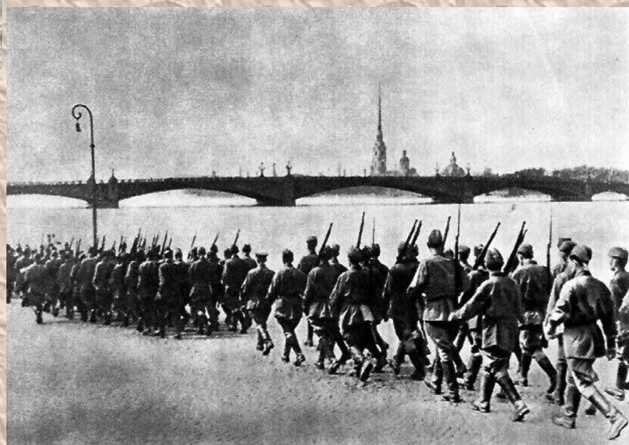
Мобилизация в Ленинграде летом 1941 года