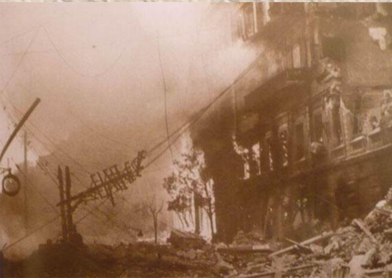
Крещатик в огне.

В первый день Великой Отечественной войны немецко-фашистская авиация нанесла воздушный удар по Киеву. 6 июля 1941 года был создан штаб обороны города. Началась 72-дневная героическая оборона. На защиту города встали не только войска, но и его жители. 19 сентября по приказу Ставки Верховного Главнокомандования Киев был оставлен советскими войсками. Гитлеровцы установили в Киеве жестокий оккупационный режим: уничтожили свыше 200 тысяч советских граждан, 100 тысяч угнали на принудительные работы в Германию. 6 ноября 1943 г. советские войска освободили столицу Украины.