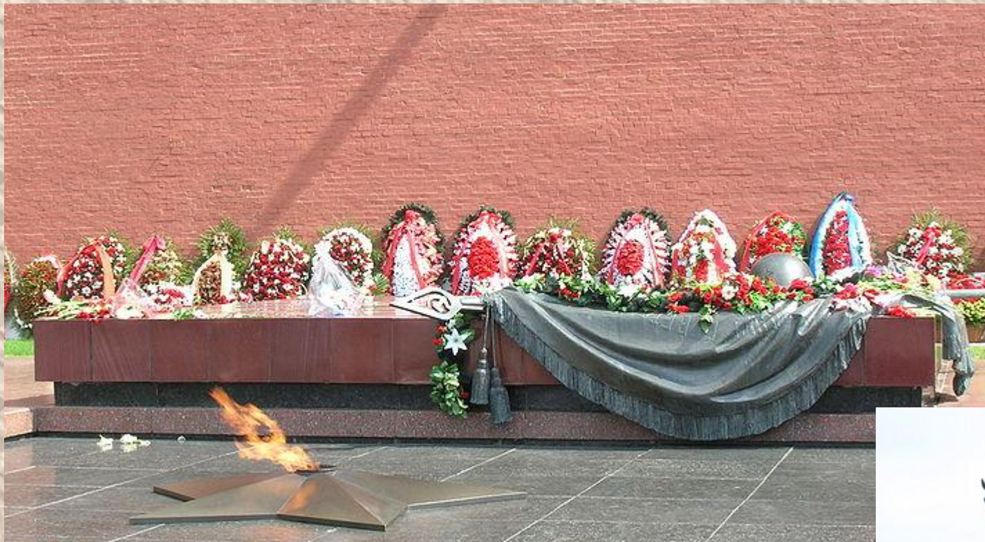
Могила Неизвестного Солдата в Москве