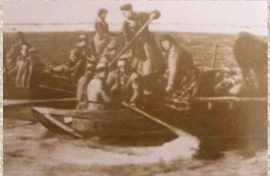
Форсирование Днепра Октябрь 1943 г.