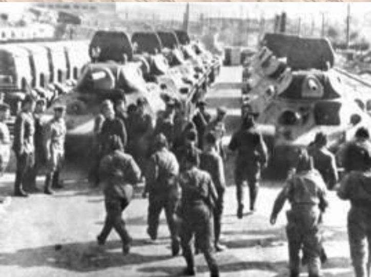
Во дворе Сталинградского тракторного завода