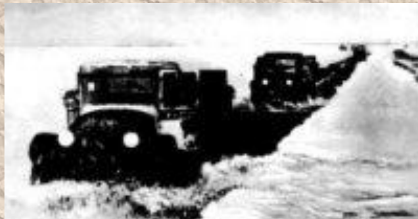
Грузовики-полторки на Дороге Жизни.