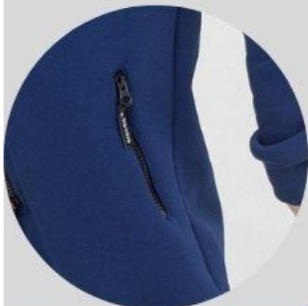
карман на молнии