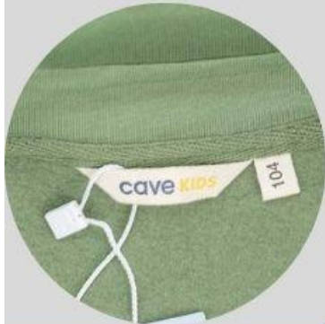
ярлык и размерник