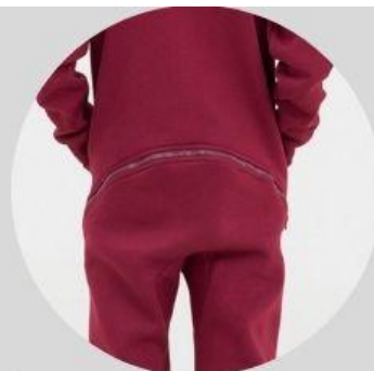
молния для туалета