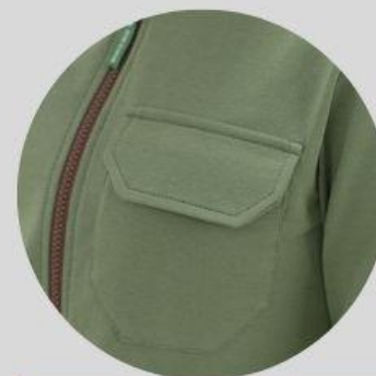
карман с клапаном