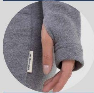
рукава до середины кисти с прорезью под большой палец