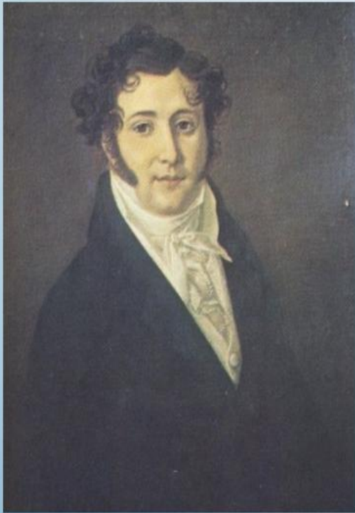
Лермонтов Ю.П., отец поэта. Портрет неизвестного художника. 1810-е гг.