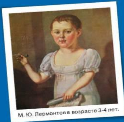
М. Ю. Лермонтов в возрасте 3-4 лет.

В ночь с 2 (14) октября на 3 (15) октября 1814 года в Москве в семье офицера на свет появился будущий великий русский поэт Михаил Лермонтов .