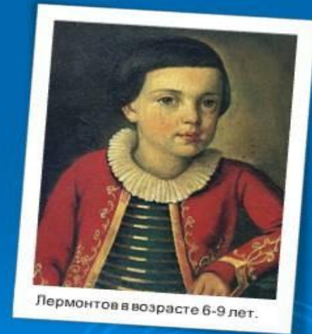
Лермонтов в возрасте 6-9 лет.

Свое детство он провёл в поместье бабушки(Тарханы, Пензенская губерния), которая прилагала все усилия, чтобы дать внуку всё, на что только может претендовать продолжатель рода Лермонтовых.