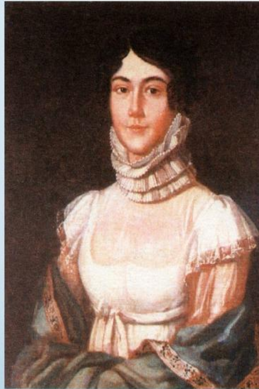
Лермонтова М.М., мать поэта. Портрет неизвестного художника. 1810-е гг.