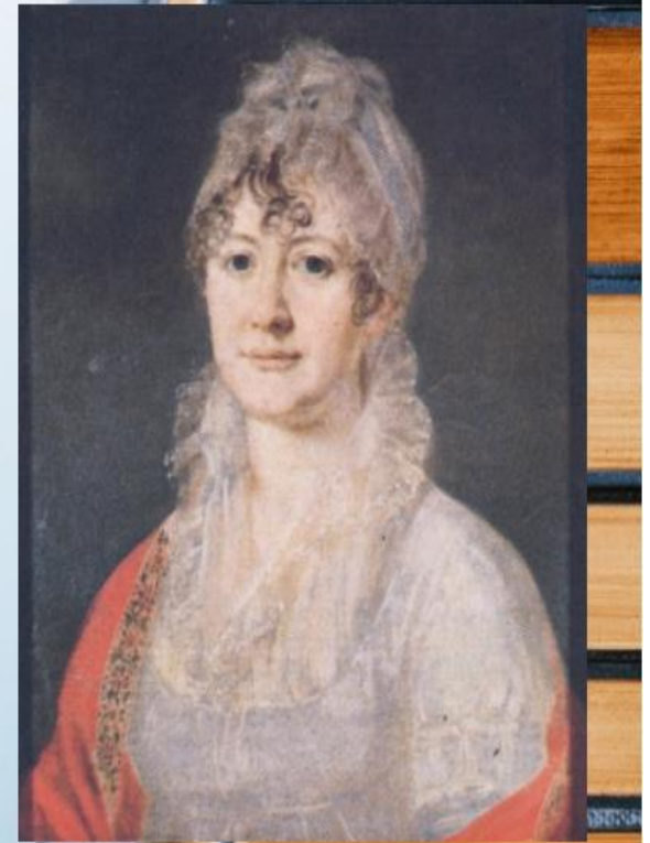
Арсеньева Е.А., бабушка поэта. Портрет неизвестного художника. Начало XIX века.