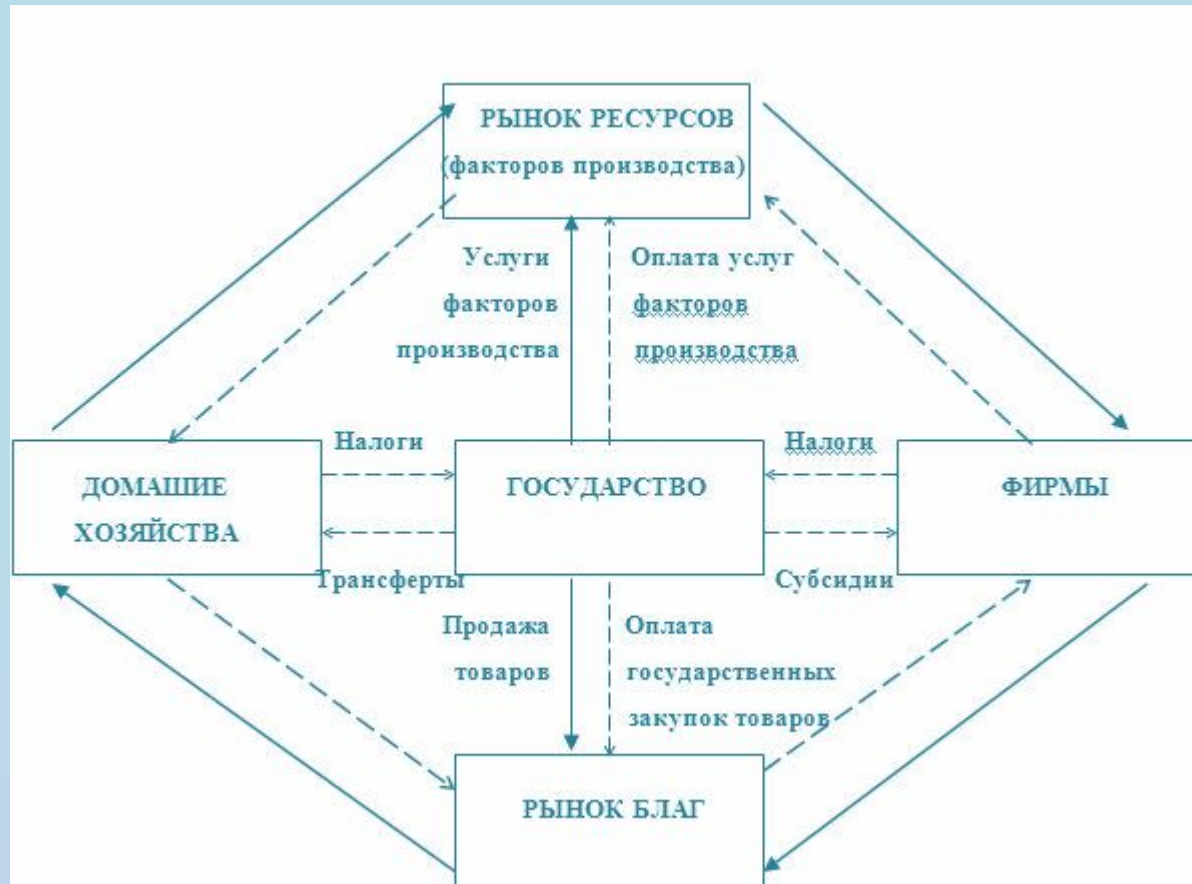
Схема кругооборота национальной экономики