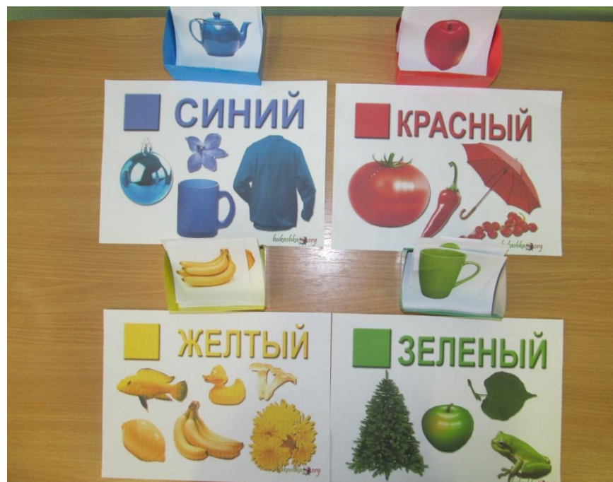
Пособие по развитию цветоощущения