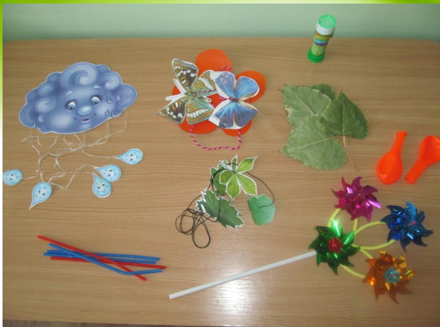
Пособия для тренировки воздушной струи