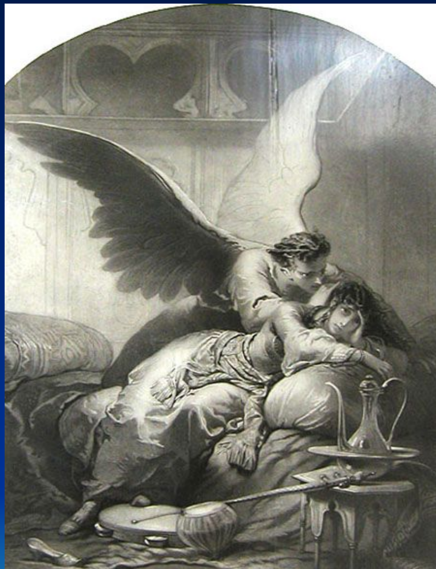
Демон и Тамара