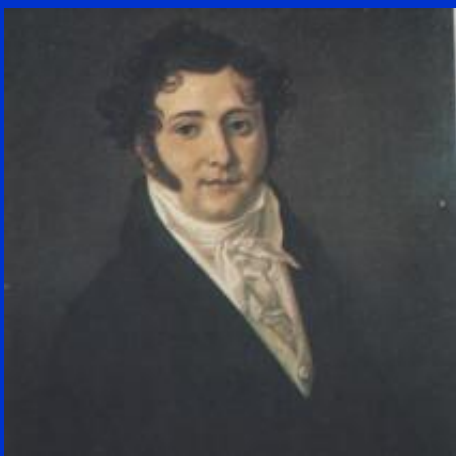
Ю. П Лермонтов, отец поэта. Портрет работы неизвестного художника. Масло. 1810-е гг.