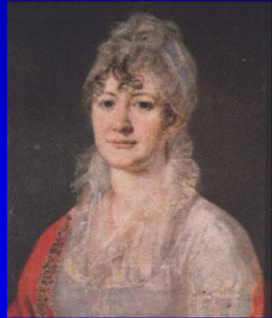
Е. А. Арсеньева, бабушка поэта. Портрет работы неизвестного художника. Масло. Нач. 19 в.

Родоначальником русской ветви Лермонтовых является Георг (Юрья) Лермонт, вышедший из Шотландии и с 1613 служивший в рядах Моск. войск. Сын Лермонта, Петр Юрьевич, в 1653 принял православие.