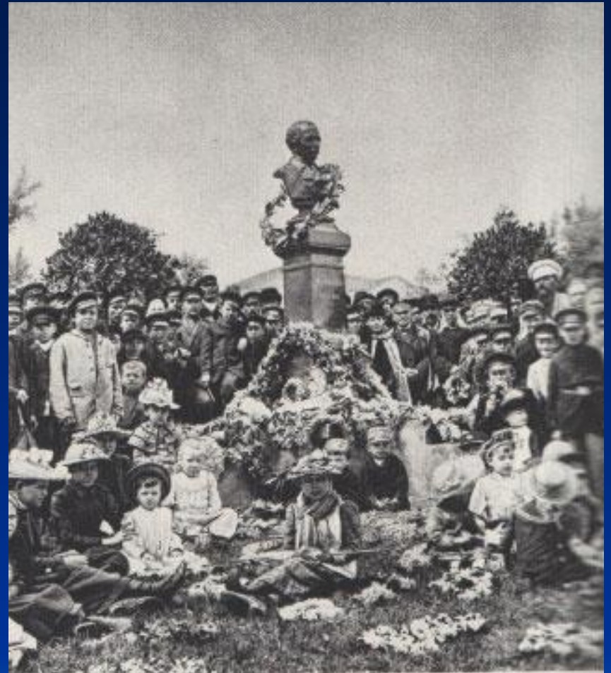
Памятник М.Ю. Лермонтову в Пензе. Скульптор И.Я. Гинцбург.