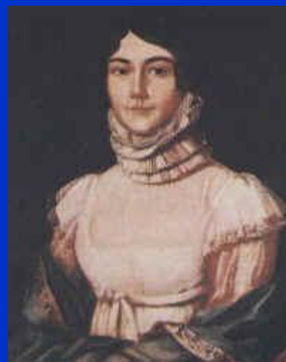
М.М. Лермонтова, мать поэта. Портрет неизвестного художника. Масло. 1810 гг