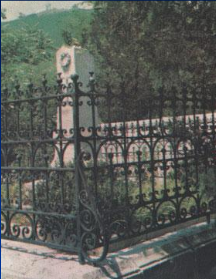
Памятник на месте первоначального погребения М.Ю. Лермонтова. Скульптор В.П. Крейтан. 1893.