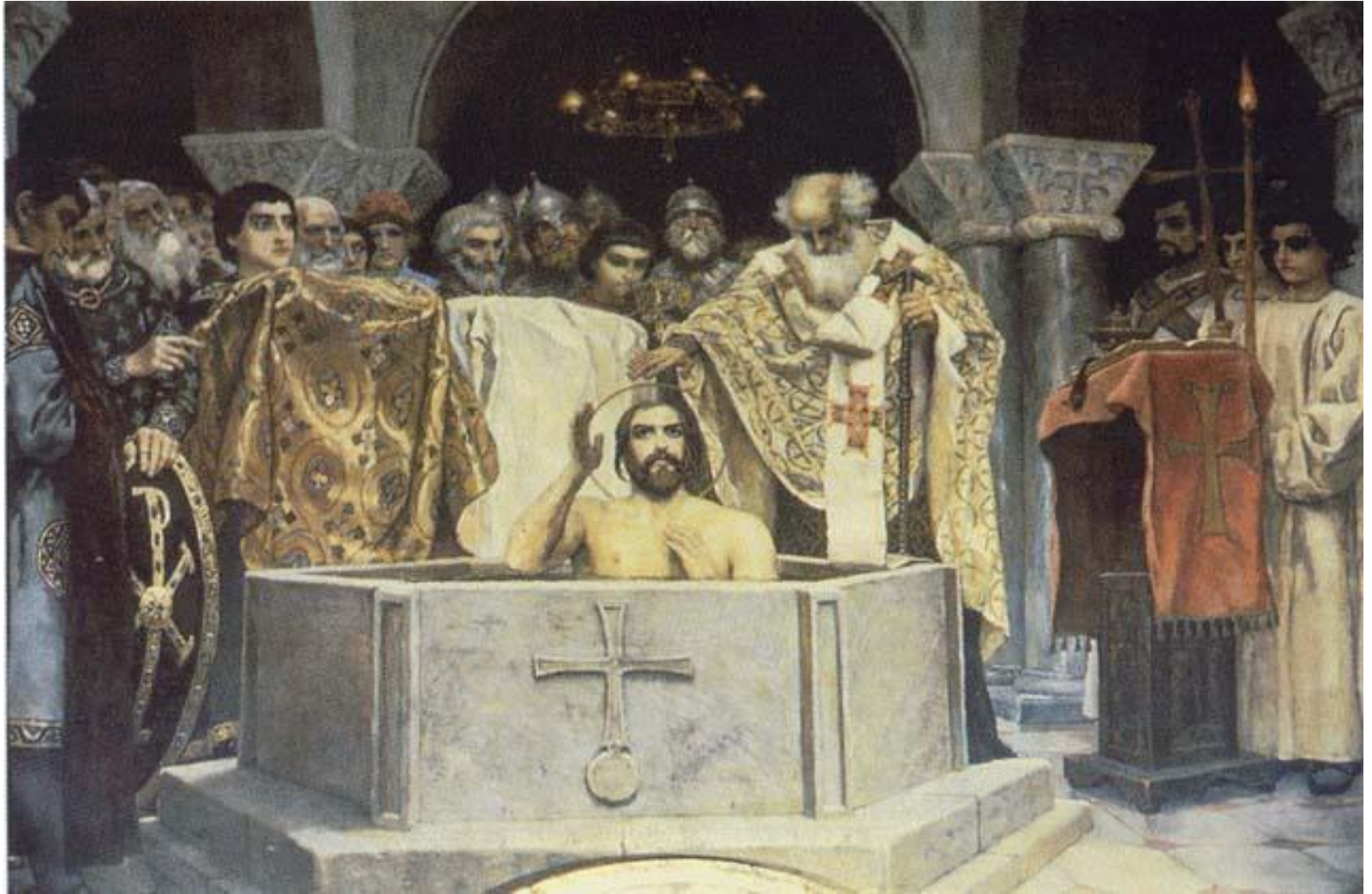
« Крещение Владимира». Васнецов В.М.

В 988 г. в Херсонесе князь Владимир принял крещение.