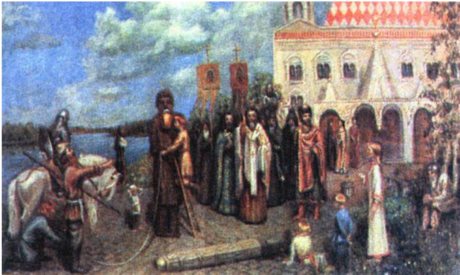
«Свержение идола Перуна». Макаров М.

Вернувшись домой в Киев, приказал опрокинуть языческих идолов.