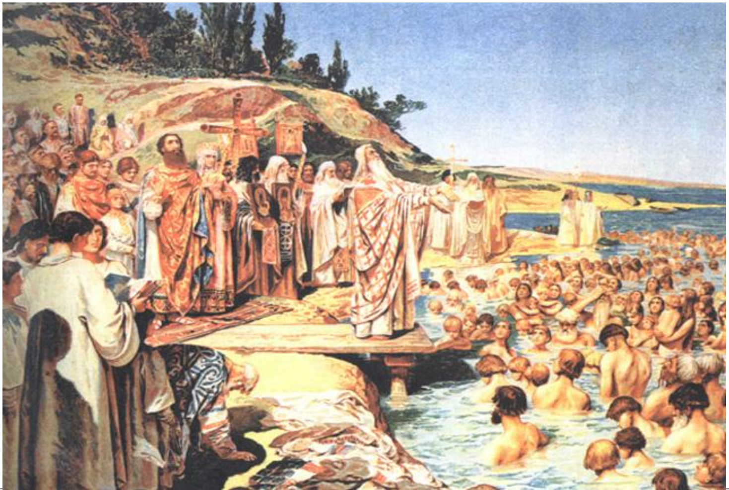
«Крещение киевлян». Лебедев К.

На следующее утро Владимир приказал всем киевлянам явиться к реке, где был совершен обряд крещения.