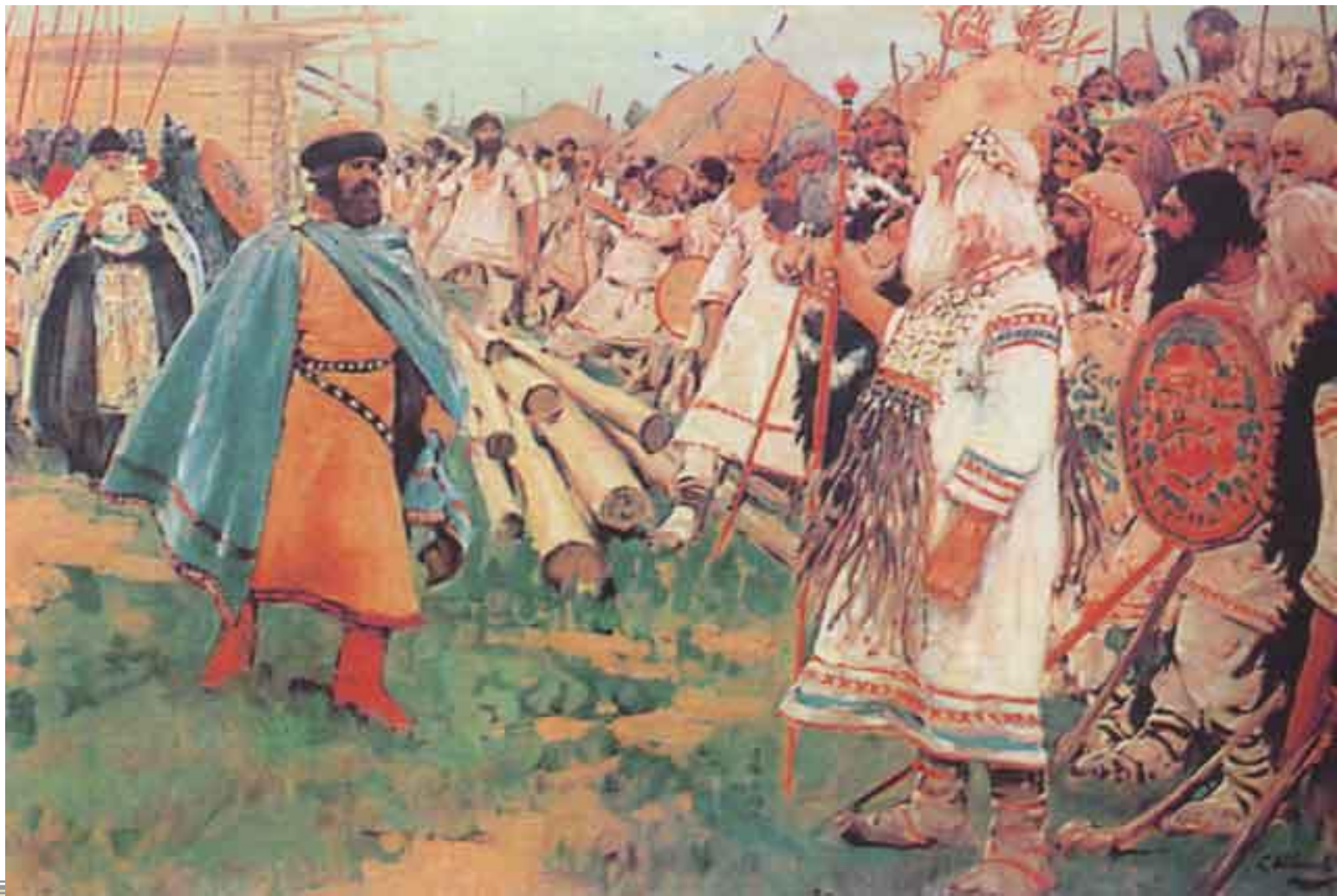
« Христиане и язычники».Иванов С.

Новая религия стала распространяться по всей Руси. Но были случаи ожесточенных столкновений язычников с княжеской дружиной.