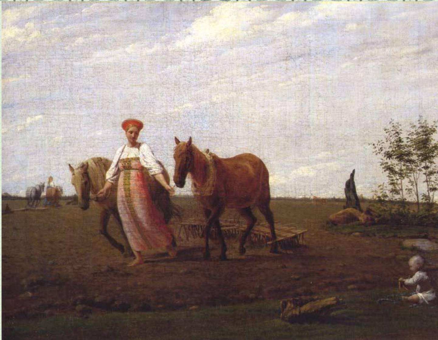
А.Г. Венецианов "На пашне.Весна"