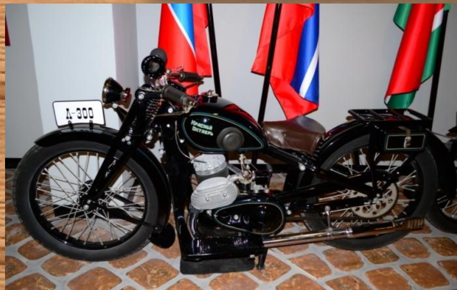
Завод «Красный октябрь».