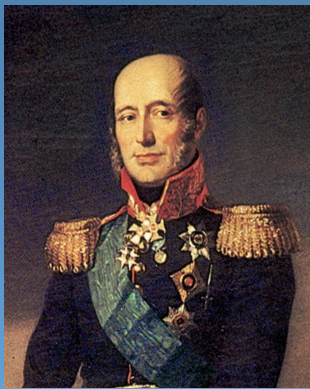
Барклай де Толли М.Б. командующий 1-ой армии