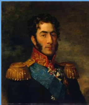
Багратион П.И. командующий 2-ой армии