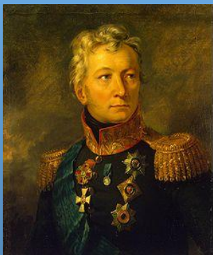
Тормасов А.П. командующий 3-ей армии