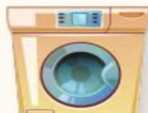
14. кір жуғыш-машина