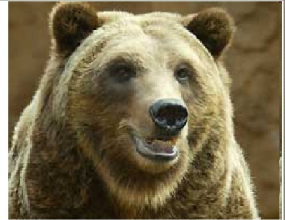
вид ведмідь бурий