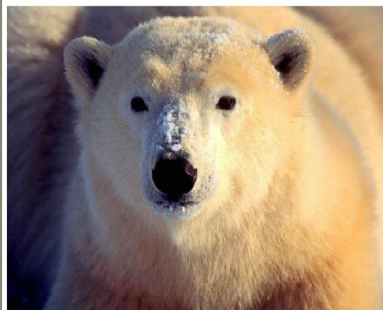
вид ведмідь білий