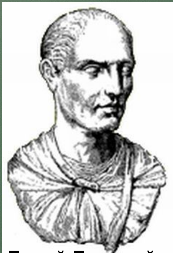
Луций Лициний Лукулл