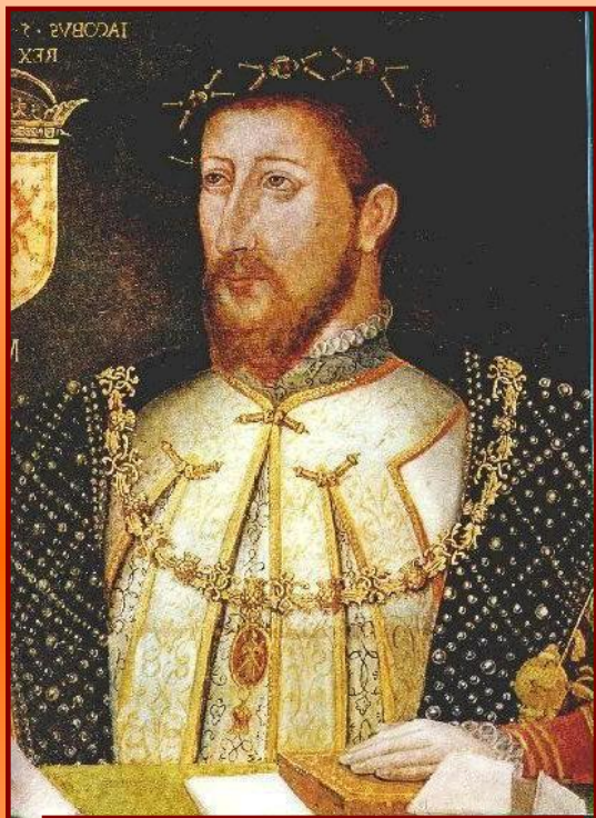
Яков I Стюарт

Вступивший на английский трон после Елизаветы Яков I Стюарт (1603-1625) в течение всего своего правления боролся с парламентом, всячески ограничивая его роль.