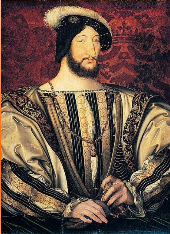
Франциск I Валуа

Во Франции абсолютная монархия начала складываться к XVI веку. Король Франциск I Валуа (1515-1547) единолично принимал все важнейшие решения, на своих указах он писал: «Ибо нам так угодно». Генеральные штаты во Франции не превратились в постоянно действующий орган, а собирались только в случае большой необходимости по решению короля. С 1614 до 1789 г. Генеральные штаты не собирались ни разу.