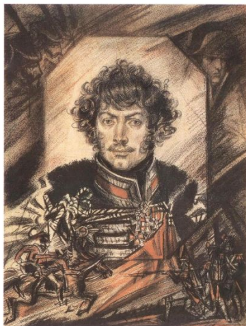
Александр Никитич Сеславин

В районе Можайска и южнее действовал отряд полковника И.М.Вадбольского. Между Боровском и Москвой дороги контролировались отрядом капитана А.Н.Сеславина. На Серпуховскую дорогу был выслан полковник Н.Д.Кудашив. На Рязанской дороге находился отряд полковника И.Е.Ефремова. С севера Москву блокировал крупный отряд Ф.Ф.Винценгероде.