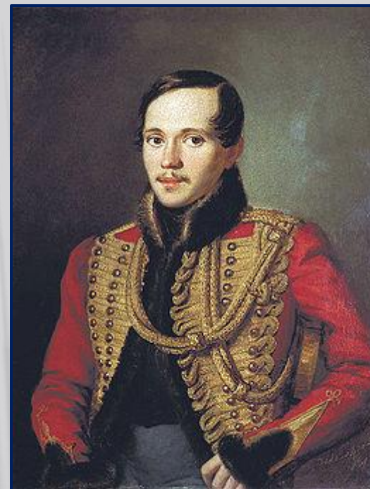
Заболотский П.Е. Лермонтов в ментике лейб-гвардии Гусарского полка (1837)