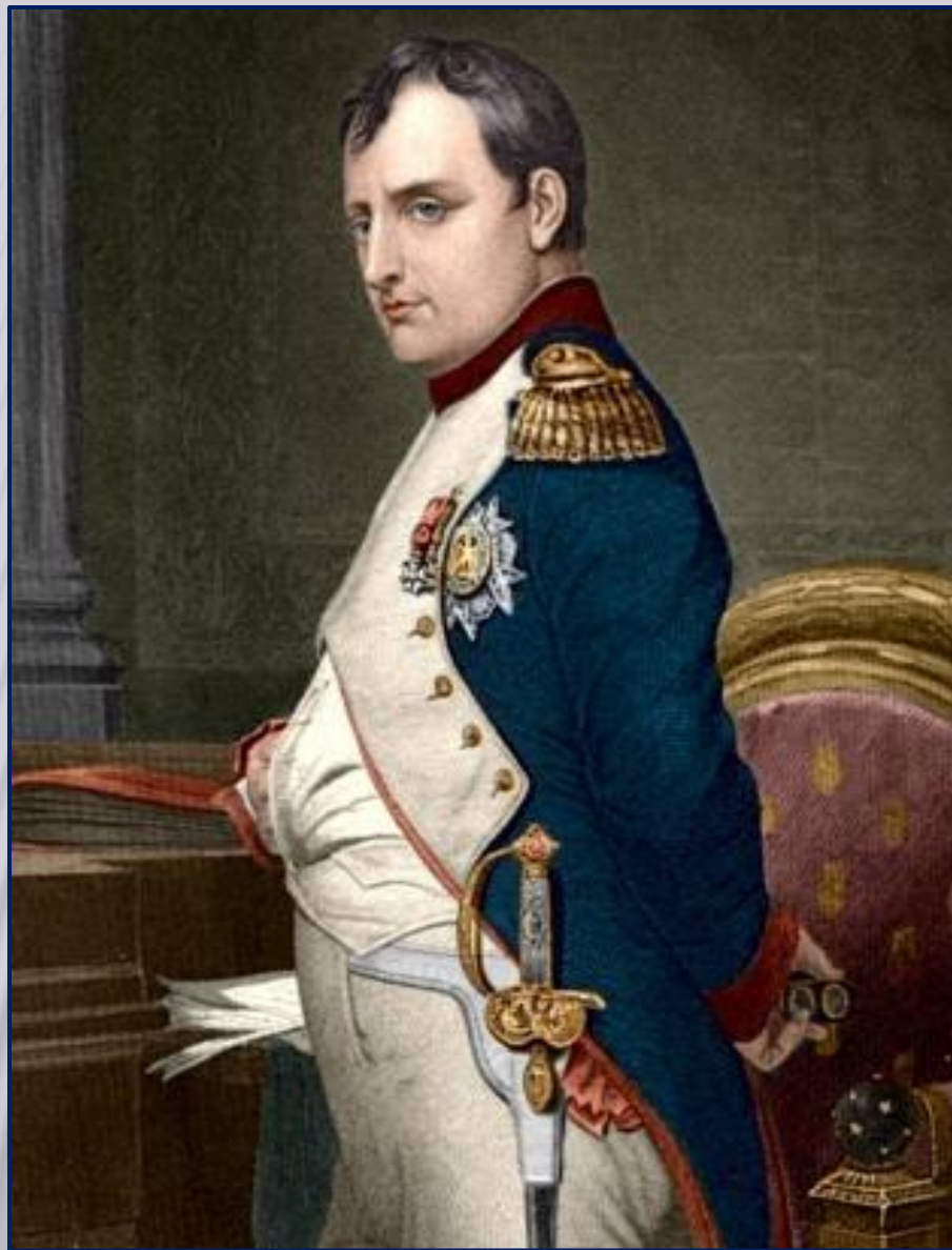
Поль Деларош, Портрет Наполеона Бонапарта