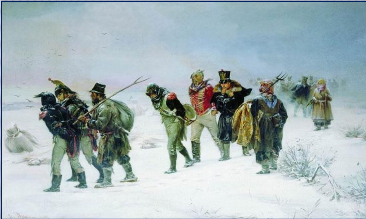
Прянишников Илларион Михайлович, В 1812 году. 1874 год. Государственная Третьяковская галерея. Москва. Холст, масло 83 x 141

Картина посвящена действиям партизанских отрядов. Здесь художник подчеркнул величие подвига русского народа, изгнавшего захватчика из родной земли. Обратите внимание, по заснеженному полю уныло бредут жалкие и оборванные, в женских шубах и шалях, “завоеватели”. Их конвоируют крестьяне с вилами и топорами. Крестьяне спокойны и уверены, они выполняют священный долг - очищают землю от врагов. На этой картине видно, что на защиту своего Отечества поднялись не только мужчины, но и женщины.