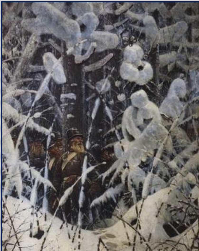
Верещагин Василий Васильевич. «Не замай, дай подойти» (1887-1895).

Высокий крепкий старик с топориком в опущенной руке, прячась за заснеженной сосной, невозмутимо всматривается вдаль. Вероятно, он не один раз ходил на медведя и знает, что надо делать. Он понимает, что с таким нехитрым оружием, как у него, необходимо подпустить врага поближе. Рядом – группа его товарищей. На их лицах - нетерпение, волнение и тревога. Сквозь заснеженные ветки заметно, что справа к месту засады подходят французы. Мудрый старый партизан удерживает приятелей от поспешных действий словами: «Не замай, дай подойти!..». Картина «Не замай - дай подойти!» обладает особым настроением. Она показывает великий национальный дух, мужество и самоотверженность народа, вступившего на нелегкий путь борьбы с врагом.