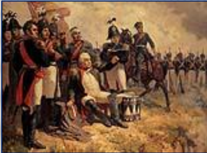
М. И. Кутузов на командном пункте в день Бородинского сражения. Художник А. Шепелюк. 1951 г.