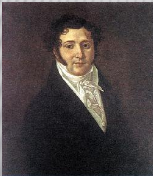
Ю. П. Лермонтов (1787—1831 гг.), отец поэта