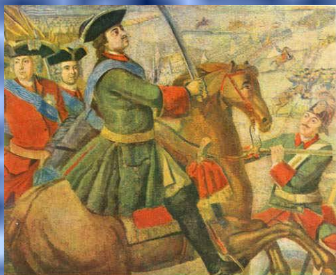
М. ЛОМОНОСОВ. Полтавская баталия (фрагмент изолдательного листа)