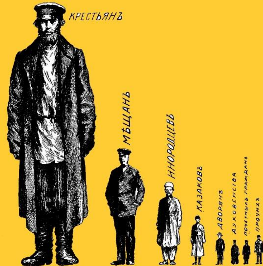
Относительная численность сословий въ Россіи.

6) КРЕСТЬЯНСТВО - основное податное сословие, 3/4 населения страны, было глубоко затронуто процессом социального расслоения: