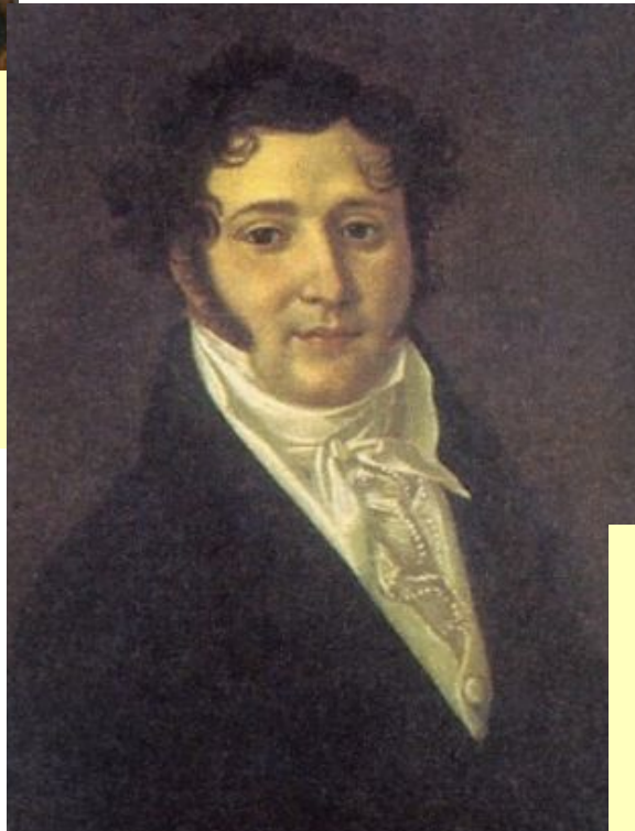
Юрий Петрович Лермонтов, отец поэта. Неизвестный художник. 1810-е