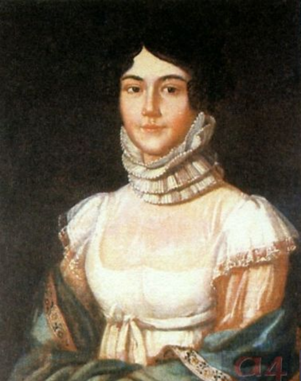
Мария Михайловна Лермонтова, мать поэта. Неизвестный художник. 1810-е