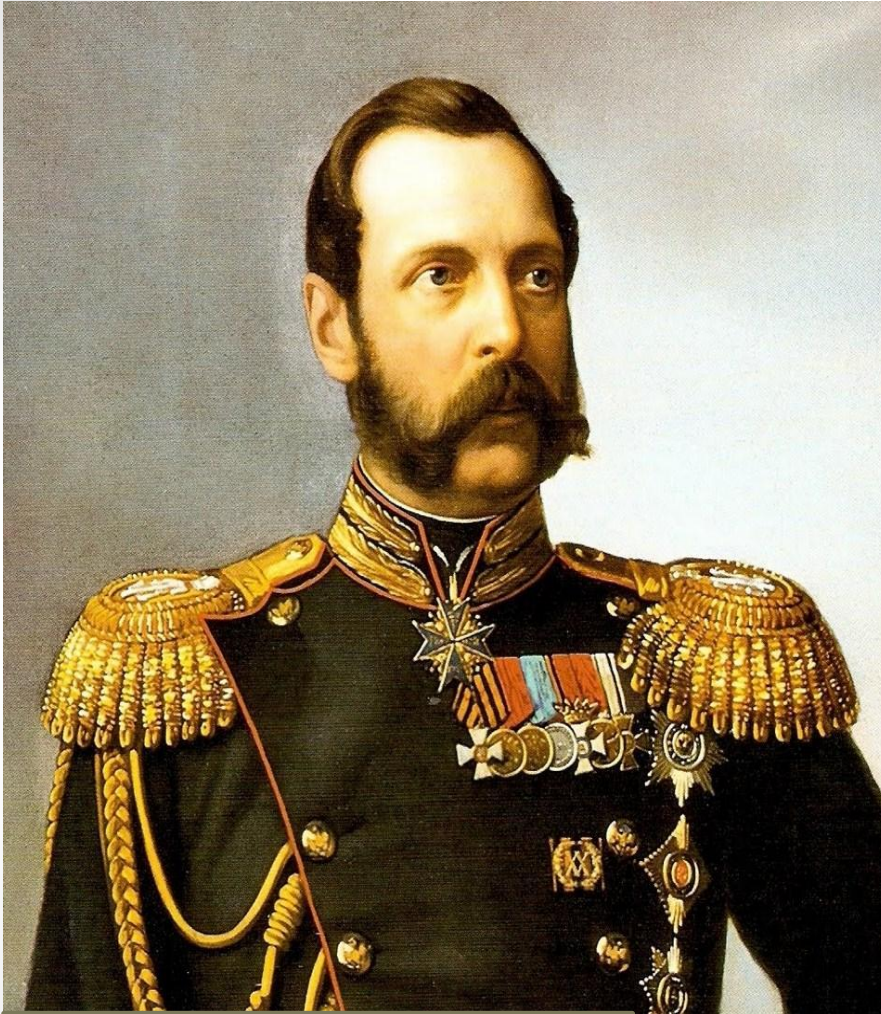
Император Александр II