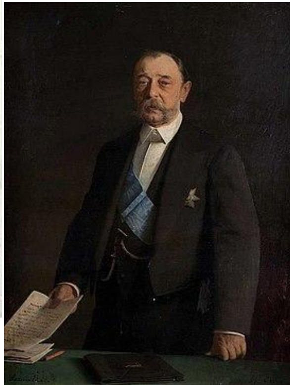
Министр Внутренних дел Д. А. Толстой