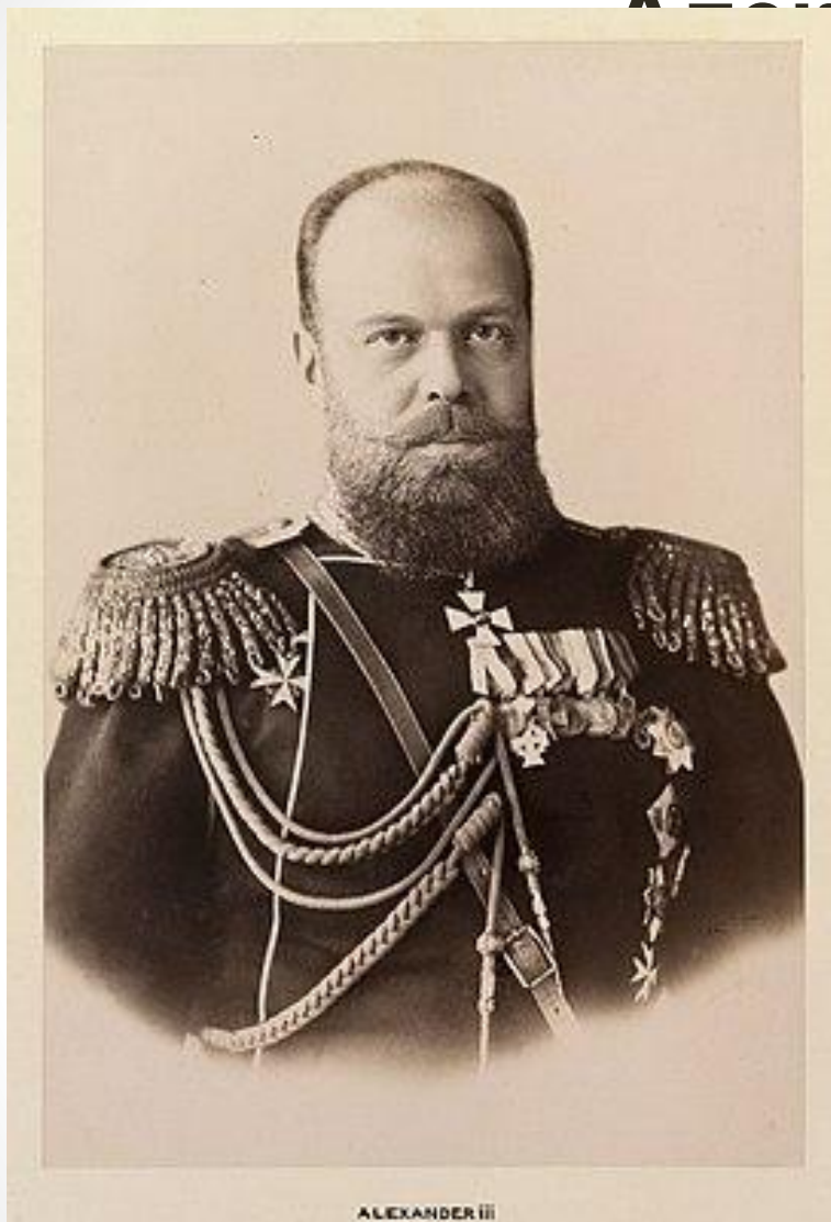
Император Александр III