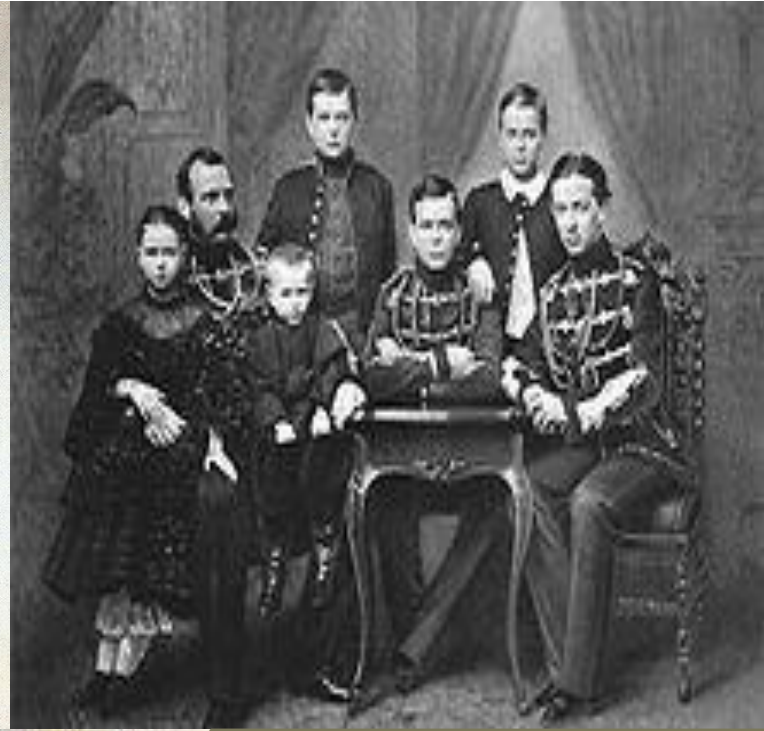
Александр II с детьми