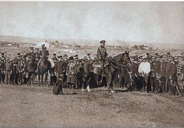
Александр II с гвардией во время осады Плевны