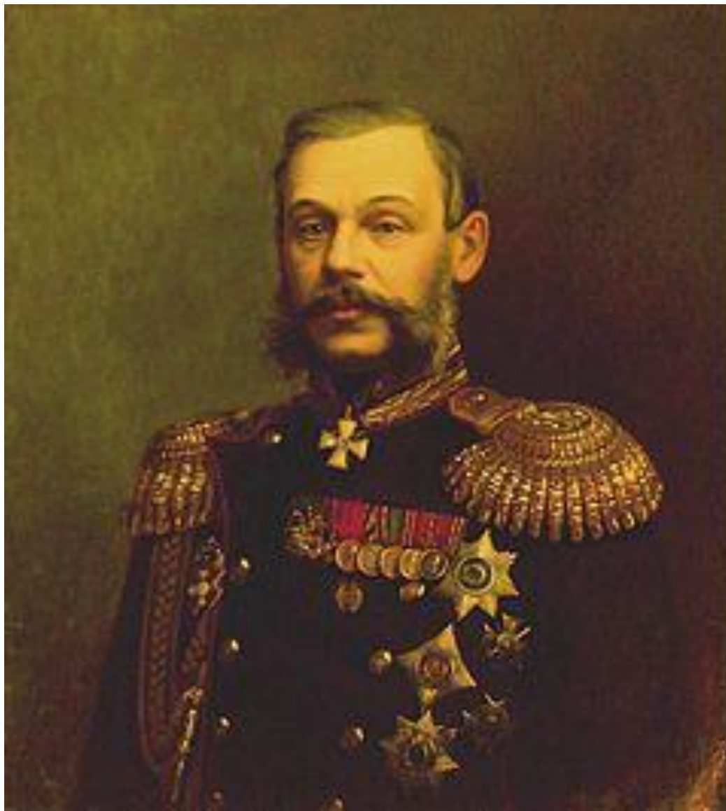
Д. А. Милютин, военный министр России в 1861-1881