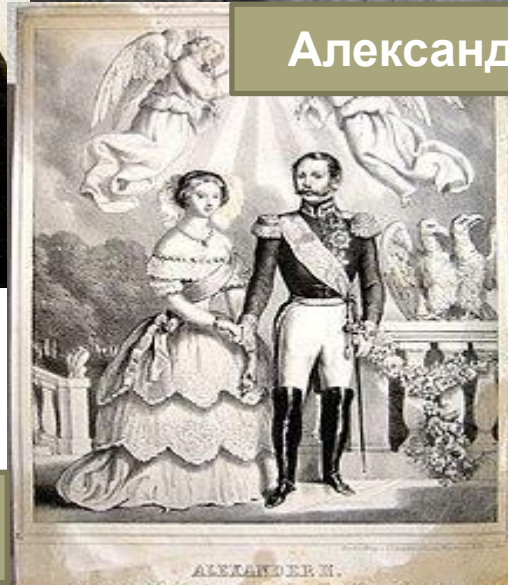
Александр II с супругой Марией Александровной