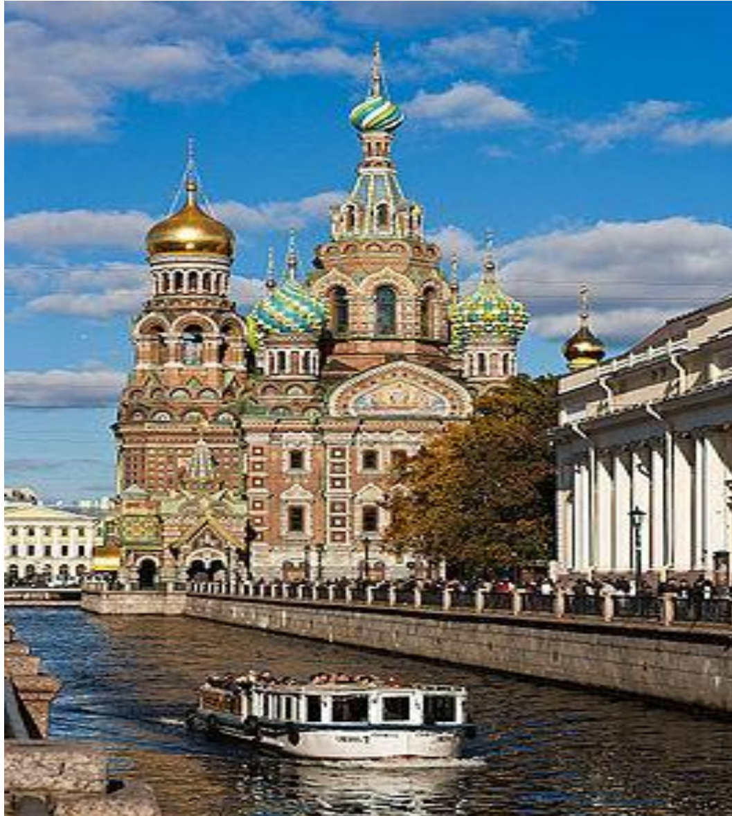
Собор Воскресения Христова, «Спас на крови», Санкт-Петербург, архитектор А. Парланд