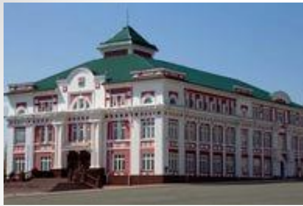
Здание Городской думы Саранска, 1912-1916. Сегодня здание Городской администрации

Городские думы – всесословные выборные органы местного городского самоуправления.