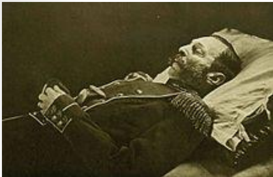
Александр II на смертном одре. Фотография С. Левицкого

1 марта 1881 года император Александр II был убит народovolьцами в результате седьмого покушения