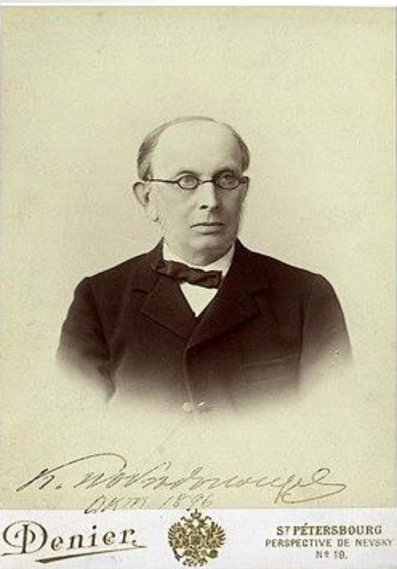
Обер-прокурор Св. Синода К.П. Победоносцев