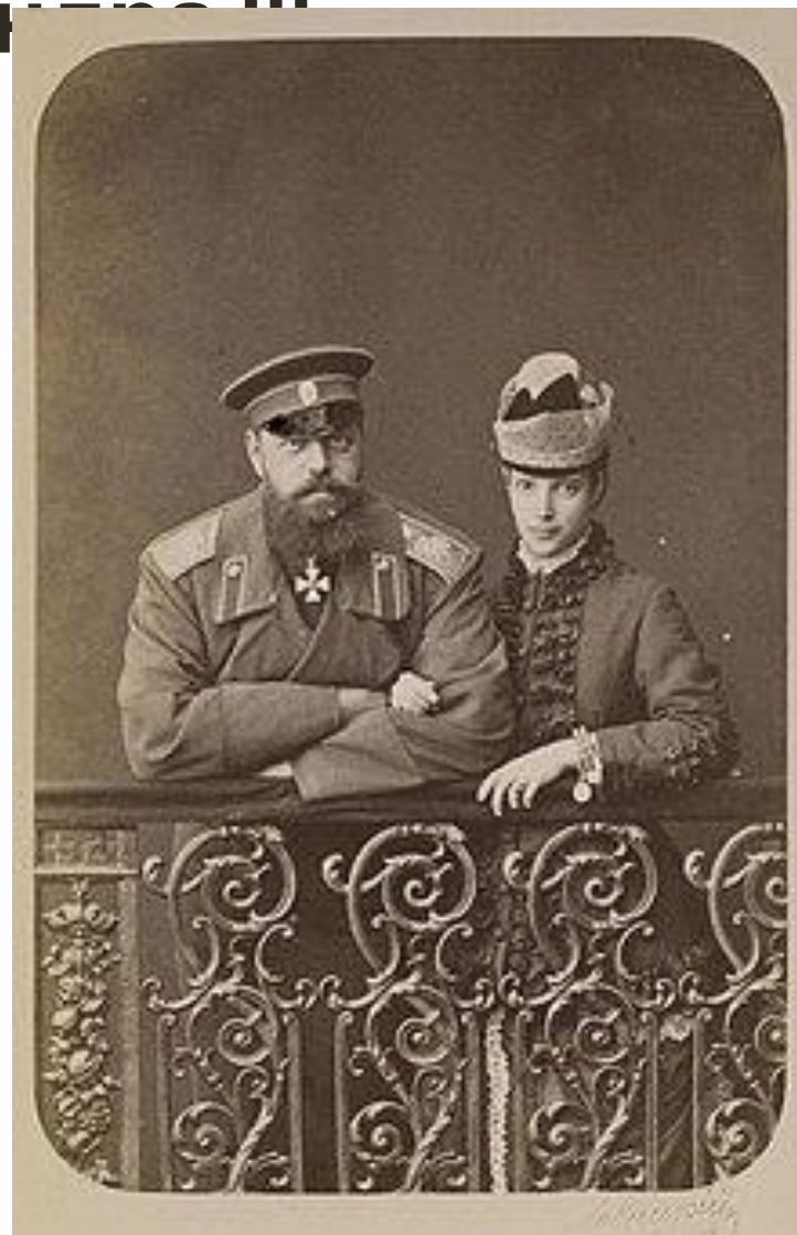
Цесаревич Александр Александрович и жена Мария Фёдоровна. Конец 1870-х гг.