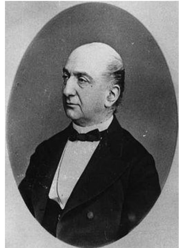
Министр народного просвещения И. Д. Делянов