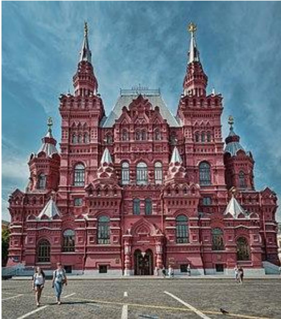
Государственный исторический музей. Открыт в 1883