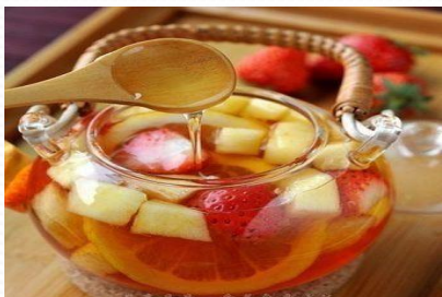
shuǐguǒ chá 水果茶 3.5元