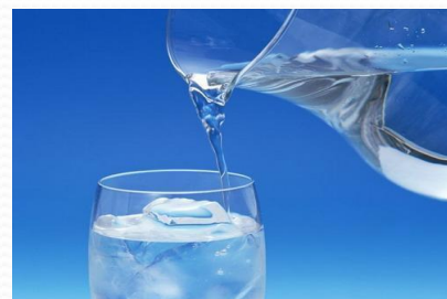
shuǐ 水 1.5元