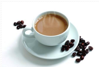
kāfēi 咖啡 3.2元