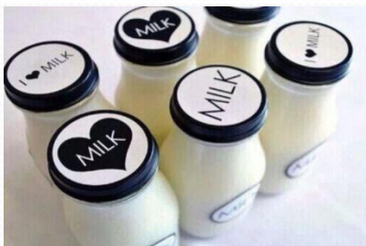
niúnnǎi 牛奶 2.5元