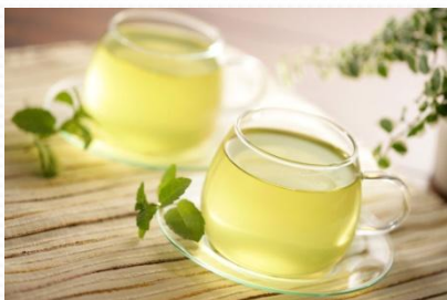
lǜchá 绿茶 3元