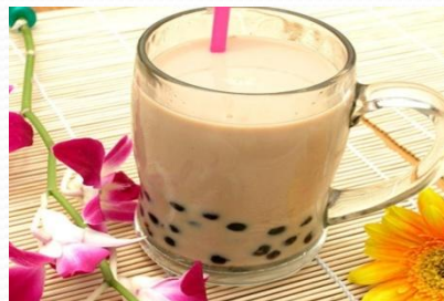
nǎichá 奶茶 3元