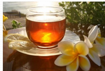
hóngchá 红茶 3元