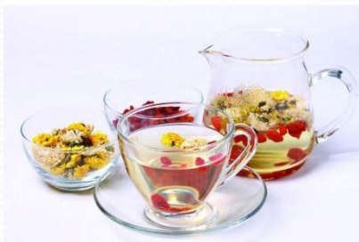
huāchá 花茶 3.2元