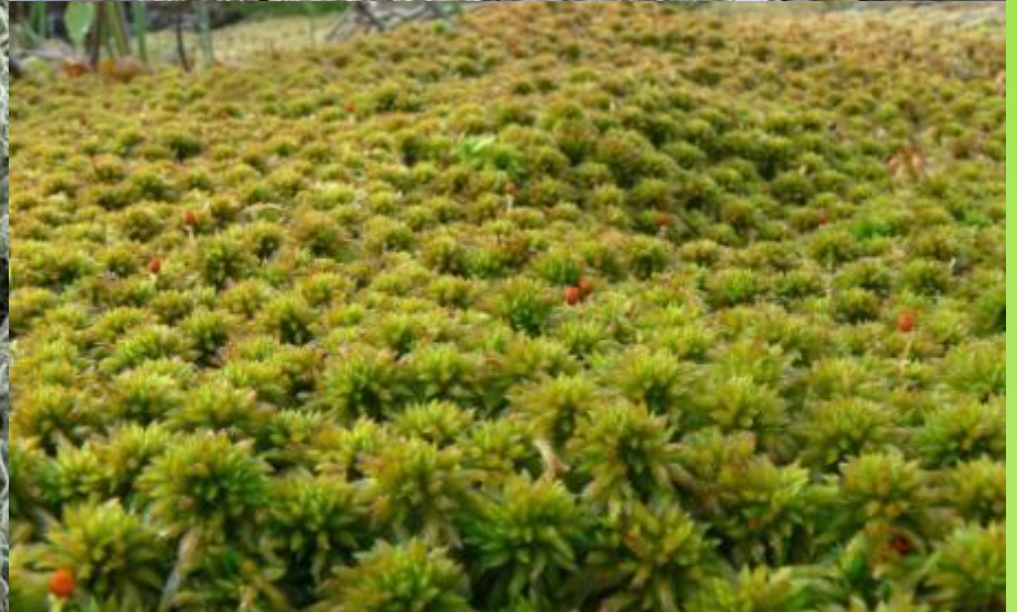
Сфагнум – белый мох