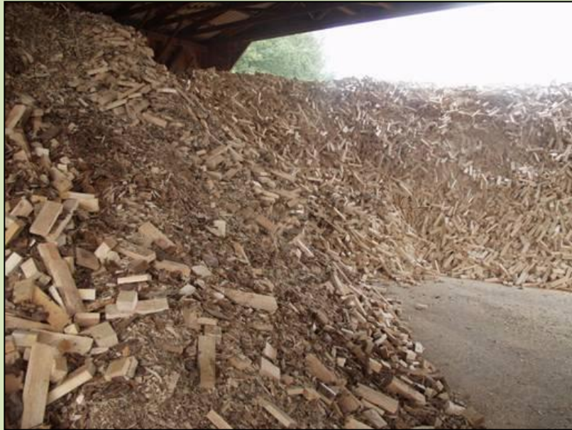
отходы лесной промышленности