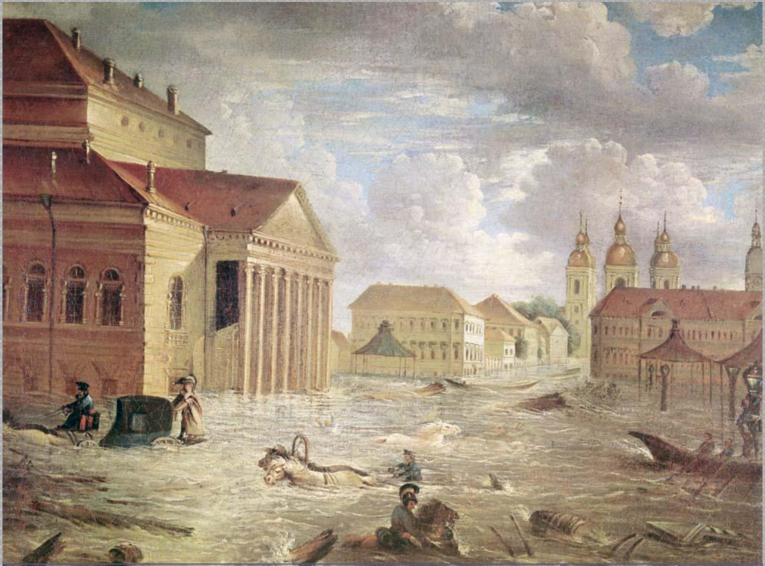
Наводнение в Санкт-Петербурге.