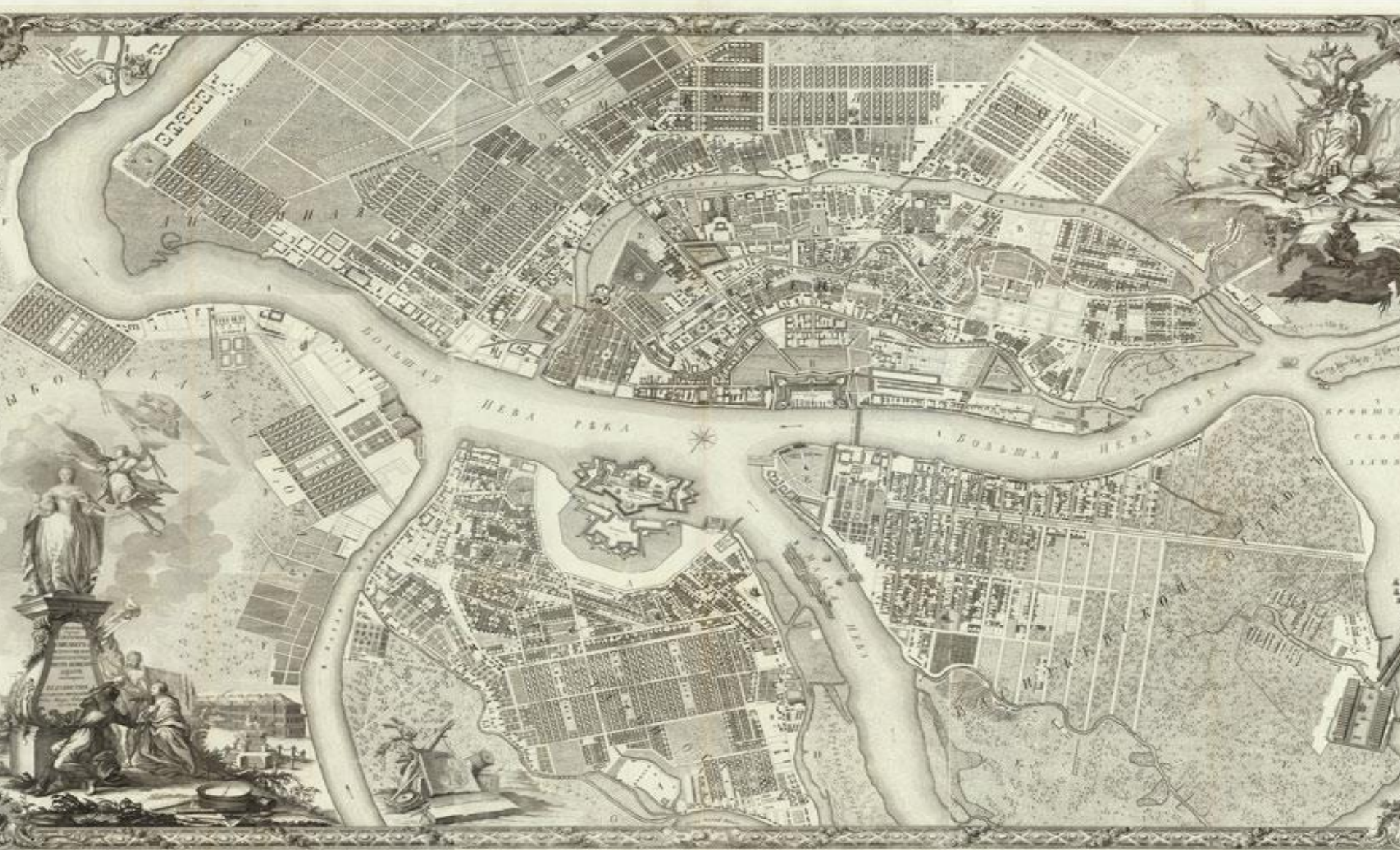
Карта Санкт-Петербурга в 1753 году