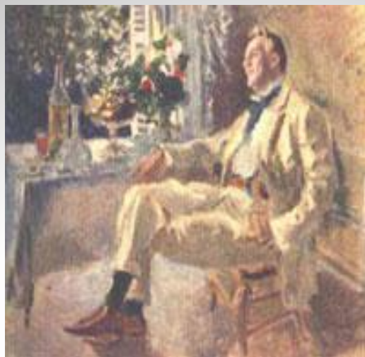
К.Коровин, «Портрет Шаляпина», 1911 г.