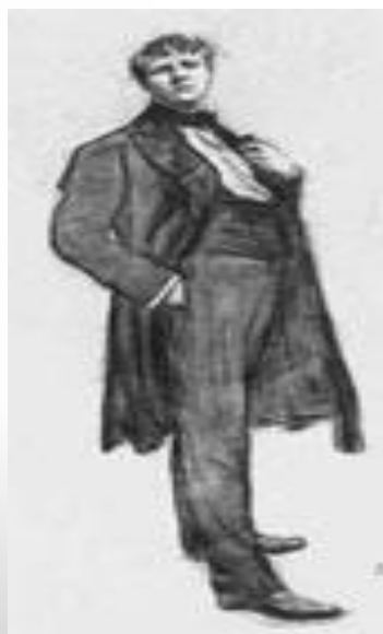
В. Серов «Портрет Ф.И. Шаляпина». 1905 г.