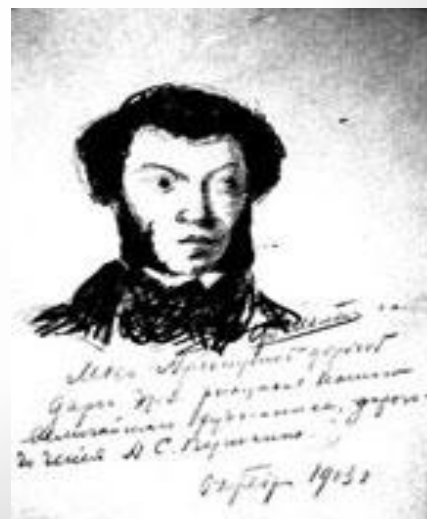
Ф.И.Шаляпин «Портрет А.С.Пушкина», рисунок с дарственной надписью дочери Ирины. 1913 г.