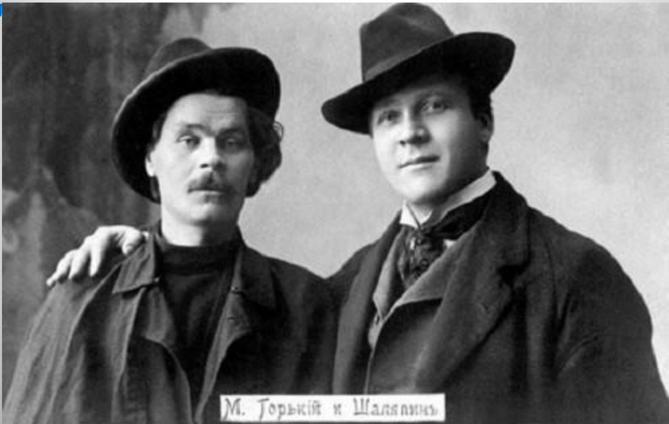
Ф.Шаляпин с М.Горьким

Глубоко национальное искусство певца восхищало его современников. «В русском искусстве Шаляпин — эпоха, как Пушкин», — писал М. Горький. В опоре на лучшие традиции национальной вокальной школы Шаляпин открыл новую эру в отечественном музыкальном театре. Он сумел удивительно органично соединить два важнейших начала оперного искусства — драматическое и музыкальное, — подчинить свой трагедийный дар, уникальную сценическую пластику и глубокую музыкал