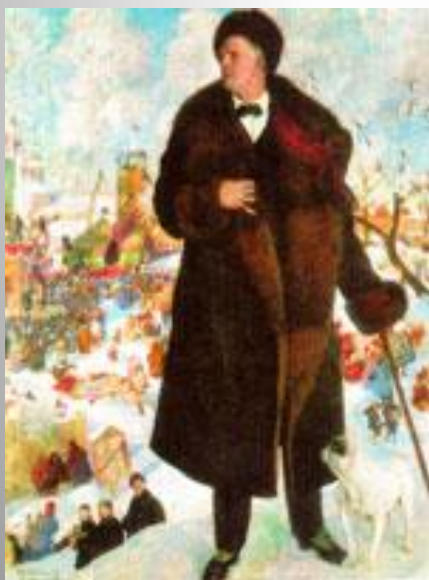
Б. Кустодиев, «Шаляпин на ярмарке в Нижнем Новгороде». 1922 г.

Но как идеальный артист и талантливый художник, он вызывал неизменный интерес и у художников, которые стремились запечатлеть его в жизни и на сцене. Правда, не у всех это получалась, т.к. Шаляпин создавал такие художественные полотна на сцене, что не каждый художник мог их повторить.