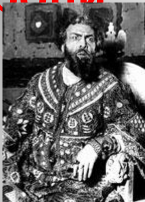
Борис Годунов из оперы «Борис Годунов»