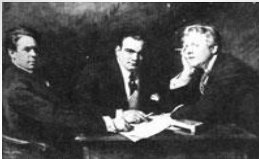
Ф.И.Шаляпин, Э. Карузо, Т. Руффо