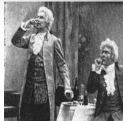
Опера «Моцарт и Сальери»