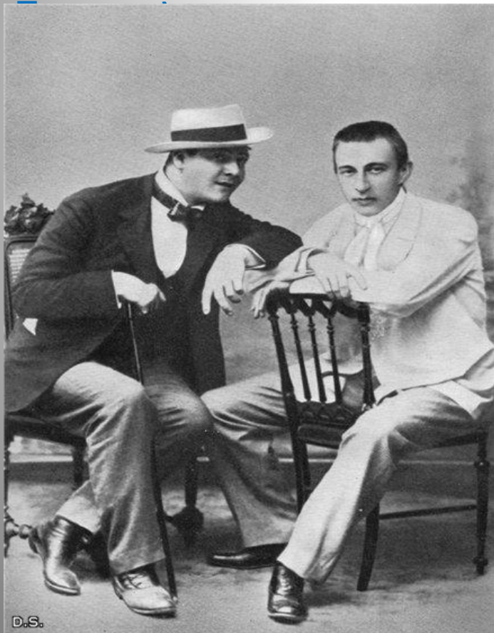
Ф.Шаляпин и С. Рахманинов

Общение в театре Мамонтова с лучшими художниками России (Поленовым, В. и А. Васнецовыми, Левитаном, Серовым, Врубелем, Коровиным) давало певцу мощные стимулы творчества: их декорации и костюмы помогали создавать убедительные сценические образы. Ряд оперных партий Шаляпин подготовил с начинающим дирижером и композитором Рахманиновым. Творческая дружба объединяла великих художников до конца жизни. Рахманинов посвятил певцу несколько романсов «Судьба» (стихи А. Апухтина), «Ты знал его» (стихи Ф.