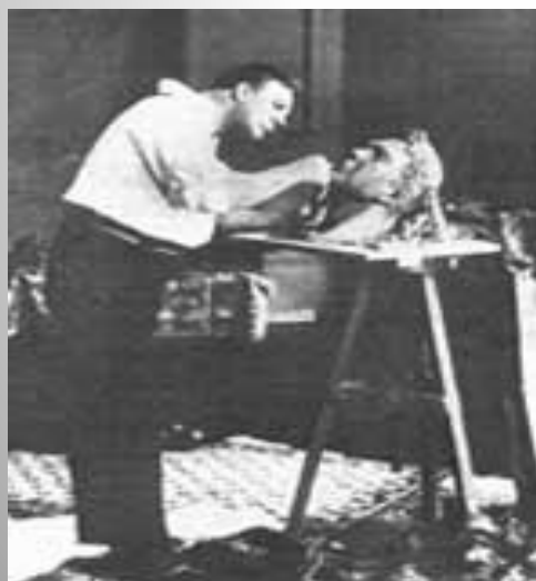
Ф. И. Шаляпин работает над своим скульптурным автопортретом