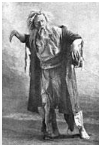
Мельник из оперы «Русалка»