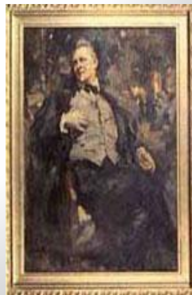
К. Коровин, «Портрет Шаляпина». 1921 г.