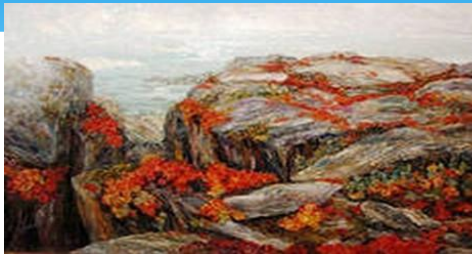
27. Илья Швачкин. Русские север. 1910. Холст на фанере, масло. 41,9 x 60, 191 см.

*В 1915 году он был призван в армию, служил ратником ополчения в Финляндии, а в 1916 году был переведен в Кронштадт. Здесь его застала февральская революция. После демобилизации в 1918 году вернулся в Архангельск. Писахов берётся за перо. Писахов решил попробовать свои силы в жанре очерков, где воссоздаёт портреты современников. Оба эти очерка были опубликованы в архангельской газете «Северное утро».