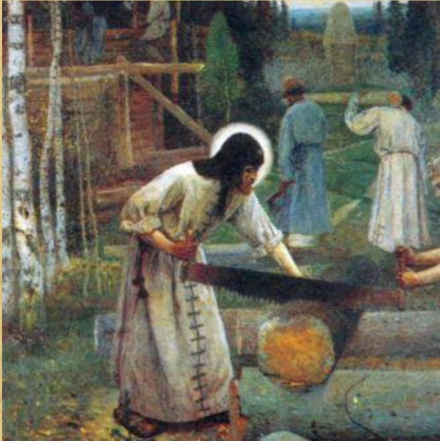
Нестеров М.В. «Труды преподобного Сергия»

Постепенно к Сергию стали приходить другие иноки, желавшие послужить Богу своими трудами. Преподобный с радостью принимал их. Так зачался Сергиев монастырь - нынешняя Троице-Сергиева лавра (по-гречески лаура - крупный, большой монастырь). "Примером своей жизни, высотой своего духа преп. Сергий поднял упавший дух родного народа, пробудил в нем доверие к себе, к своим силам, вдохнул веру в будущее". Из его поколения вышли основатели 150 новых монастырей. Они жили в маленьких избушках-кельях, сами носили воду, рубили дрова, обрабатывали огород и готовили пищу. Преподобный Сергий делал большую часть тяжёлой работы, подавая пример братии.