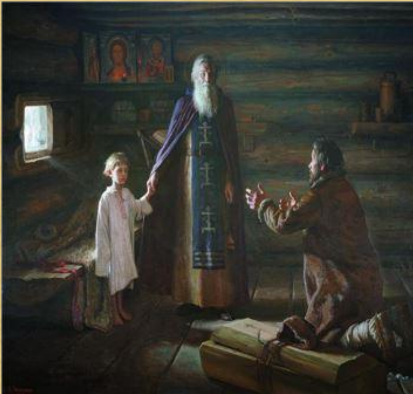
Воскрешение отрока Сергием Радонежским.

Согласно житию, Сергей Радонежский совершил множество чудес. Люди приходили к нему из разных городов для исцеления, а иногда даже для того, чтобы просто увидеть его. Как утверждает житие, однажды он воскресил мальчика, который умер на руках отца, когда он нёс ребёнка к святому для исцеления.