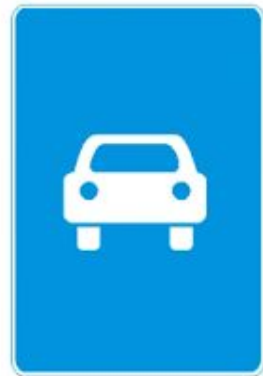
5.3 Дорога для автомобилей