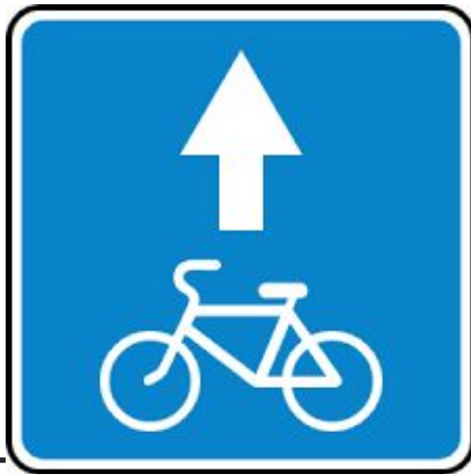
Знак «Полоса для велосипедистов»