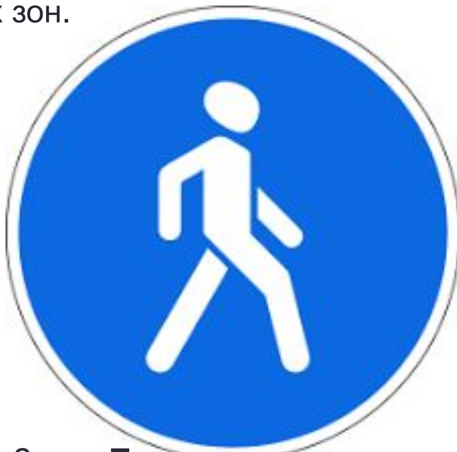
Знак «Пешеходная дорожка»

В том случае, если отсутствует велосипедная или велопешеходная дорожка, велосипедист может двигаться по тротуарам и пешеходным дорожкам, обозначенным специальным знаком, а также в пределах пешеходных зон.