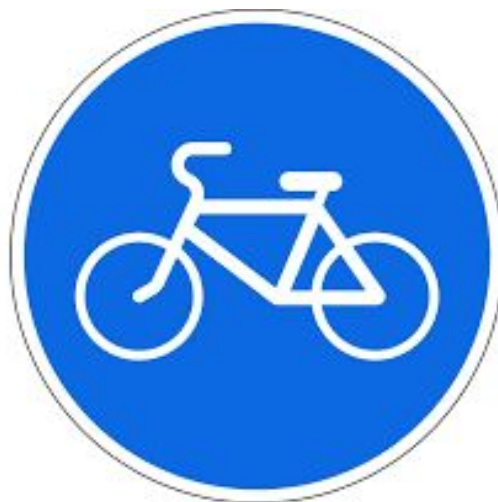
Знак «Велосипедная дорожка»

Наверняка вы обращали внимание на синие дорожные знаки круглой формы, на которых изображён велосипед. На участках, обозначенных этими знаками, движение на велосипеде разрешено