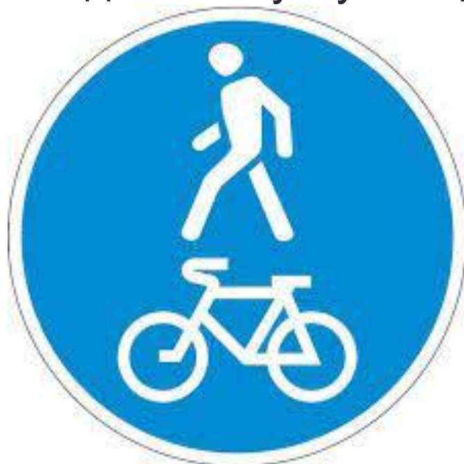
Знак «Пешеходная и велосипедная дорожка с совмещённым движением»

Если к изображению велосипеда на знаке добавляются силуэт человека, то движение по обозначенному им участку разрешается уже не только водителям велосипедов, но и пешеходам. На таком участке водители велосипедов и пешеходы равноправны и должны при необходимости уступать друг другу дорогу.