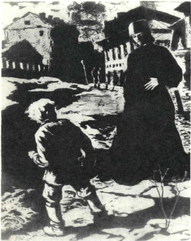
Первая встреча Алеши с Илюшей Снегиревым. Худ. В. Лодягин, 1947 г.