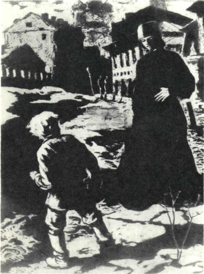
Первая встреча Алеши с Илюшей Снегиревым. Худ. В. Лодягин, 1947 г.