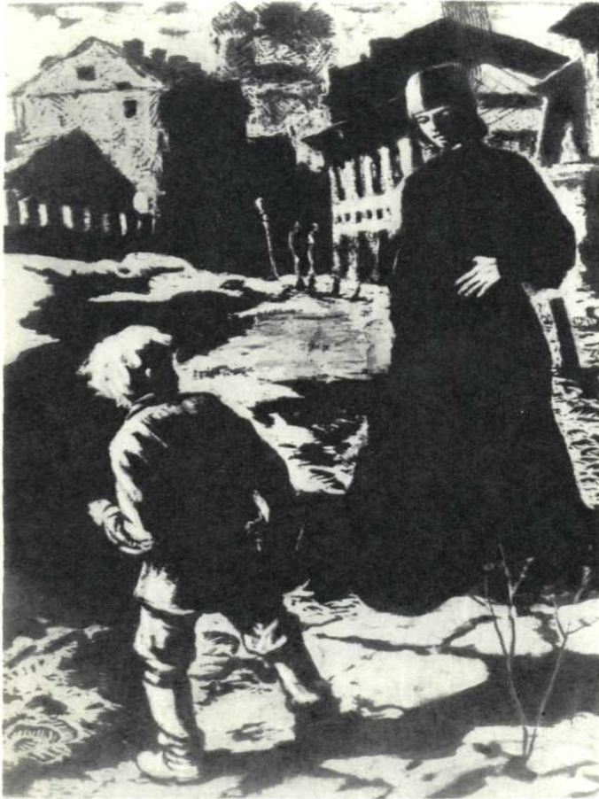
Первая встреча Алеши с Илюшей Снегиревым.