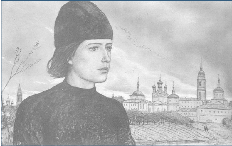
И.Глазунов Алёша Карамазов