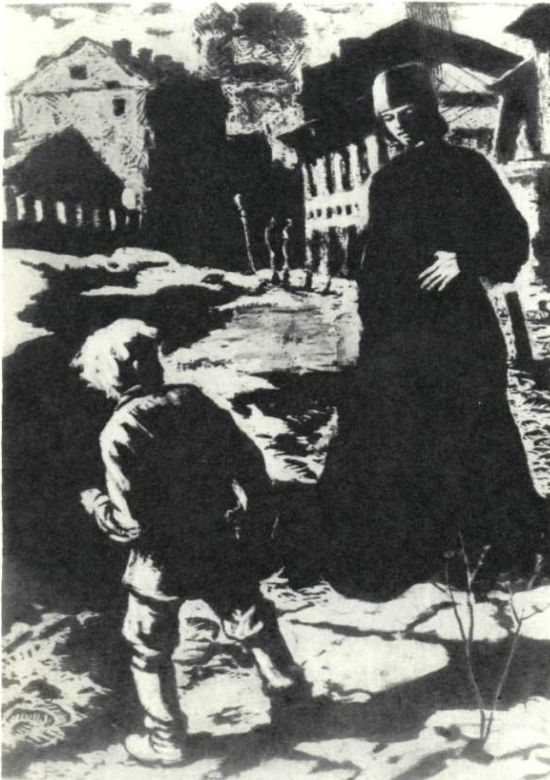
Первая встреча Алеши с Илюшей Снегиревым. Худ. В. Лодягин, 1947 г.