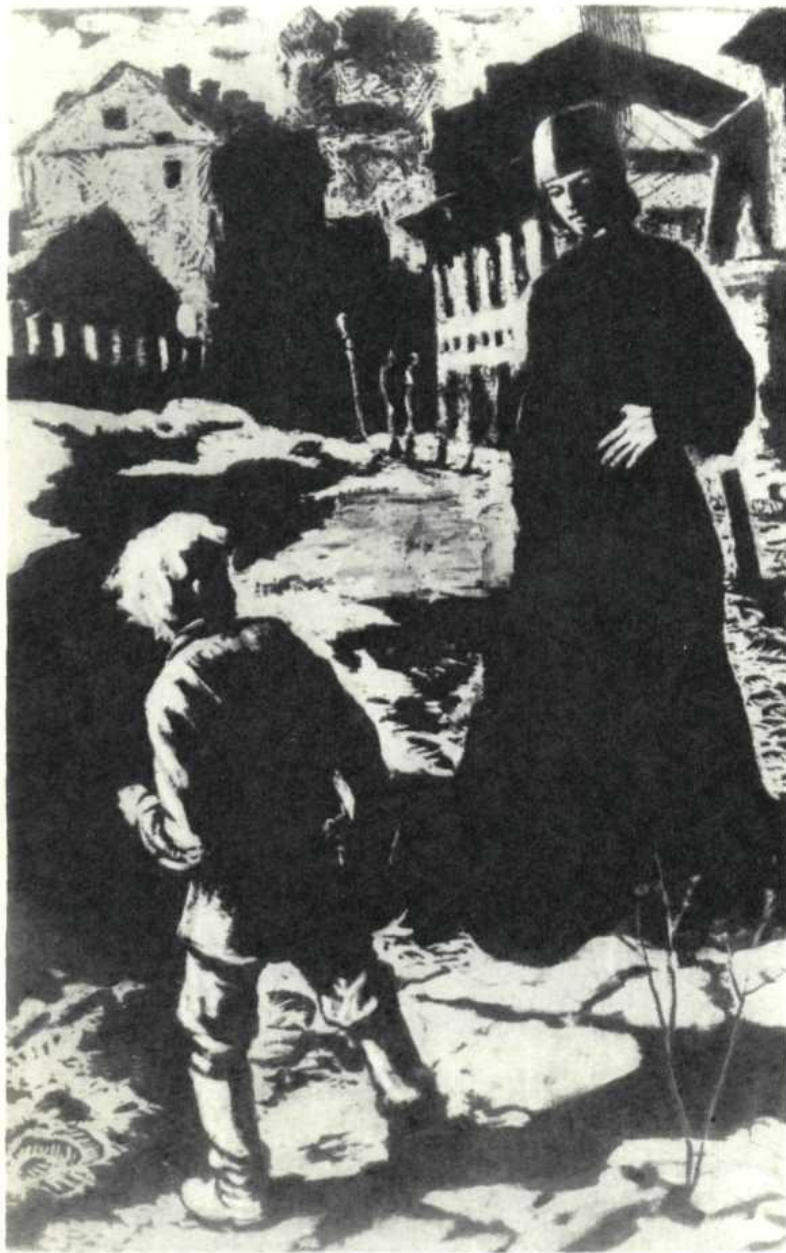
Первая встреча Алеши с Илюшей Снегиревым.