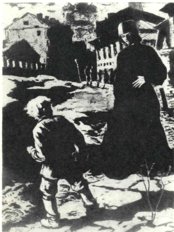
Первая встреча Алеши с Илюшей Снегиревым. Худ. В. Лодягин, 1947 г.

Спрогнозируйте дальнейшие действия мальчика за канавкой, героя, который оказался в сложной ситуации.