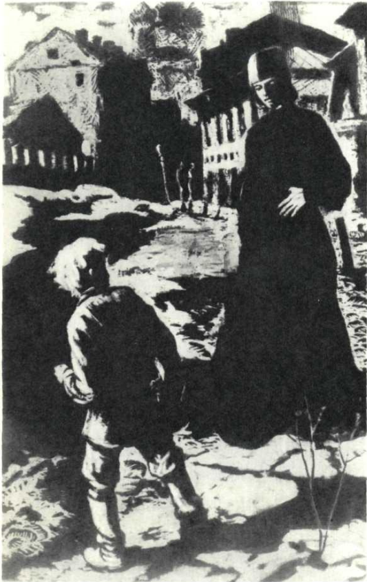
Первая встреча Алёши с Илюшей Снегиревым. Худ. В. Лодягин, 1947 г.