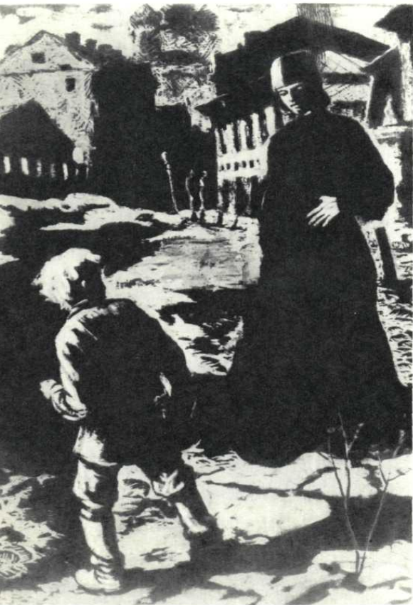
Первая встреча Алёши с Илюшей Снегиревым.

Раздражительный, грубый: « Не приставайте! »- сказал он Алёше. Ведёт себя вызывающе, обозвал Алёшу монахом, пускает ему в спину булыжник, то есть нападает исподтишка, провоцирует Алёшу на драку.