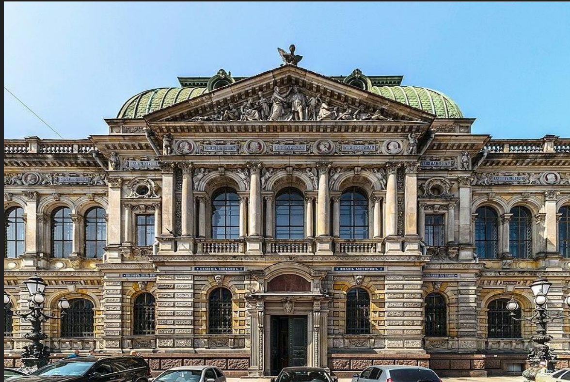
Художественное училище барона Штиглица в Петербурге