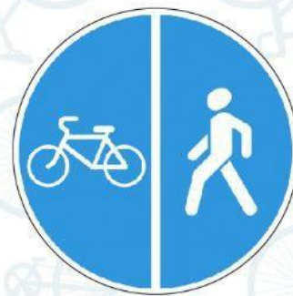
4.5.4. Велопешеходная дорожка с разделением движения