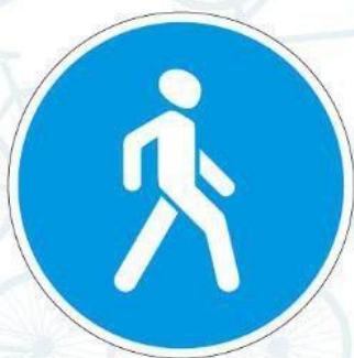
4.5.1. Пешеходная дорожка