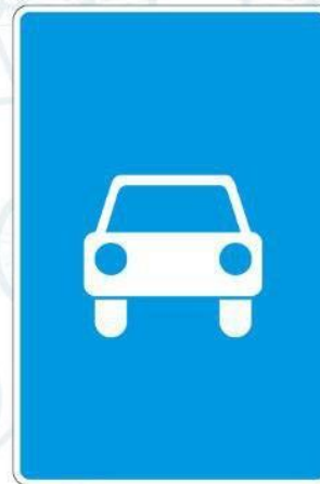
5.3. Дорога для автомобилей

В местах, где они установлены, движение на велосипедах запрещено