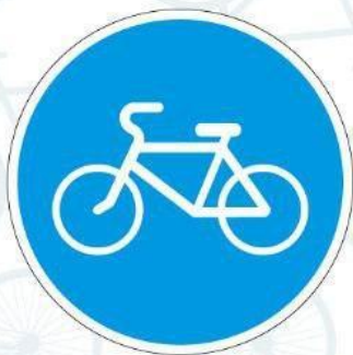
4.4.1. Велосипедная дорожка