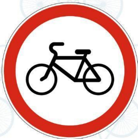
3.9. Движение на велосипедах запрещено