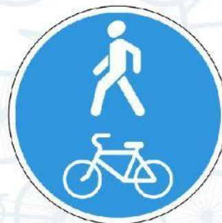
4.5.2. Совмещенная велопешеходная дорожка