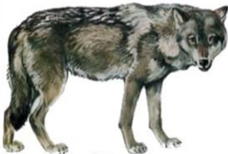
Волк (до 1,6 м)