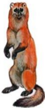
Колонек (до 39 см)