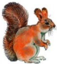
Белка (до 28 см)