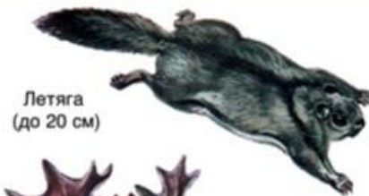
Летяга (до 20 см)