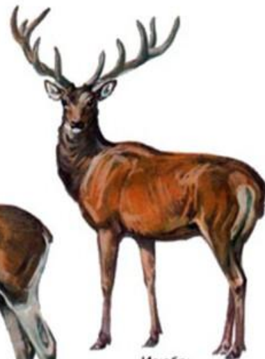
Изюбрь (до 2 м)