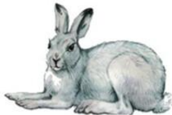
Заяц-беляк (до 74 см)