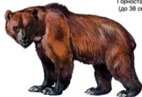
Бу́рый медведь (до 2,5 м)