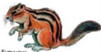
Бурундук (до 16 см)