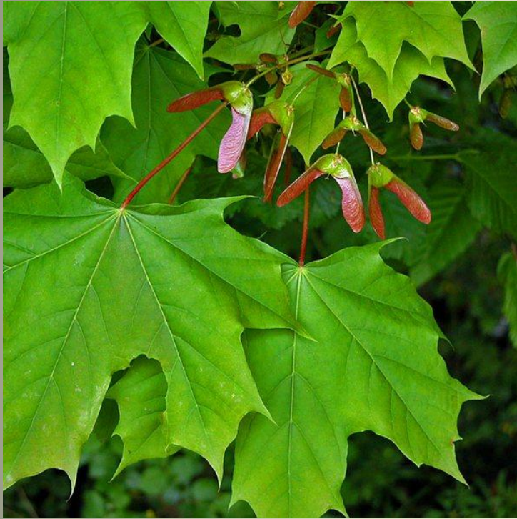
Клён остролистный (с резными листьями)