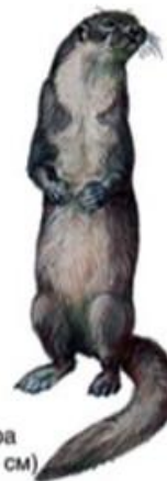
Выдра (до 75 см)