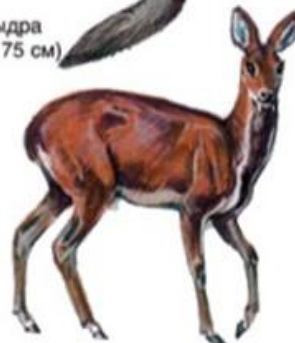
Кабарга (до 1 м)