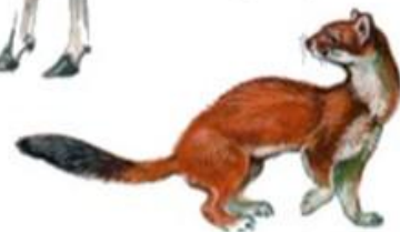
Горноста́й (до 38 см)