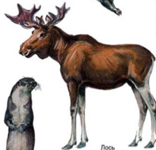
Лось (до 3 м)