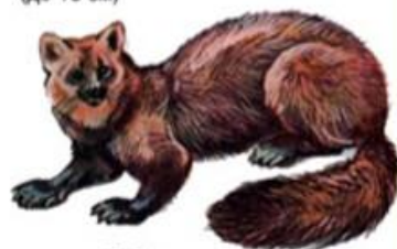
Соболь (до 53 см)