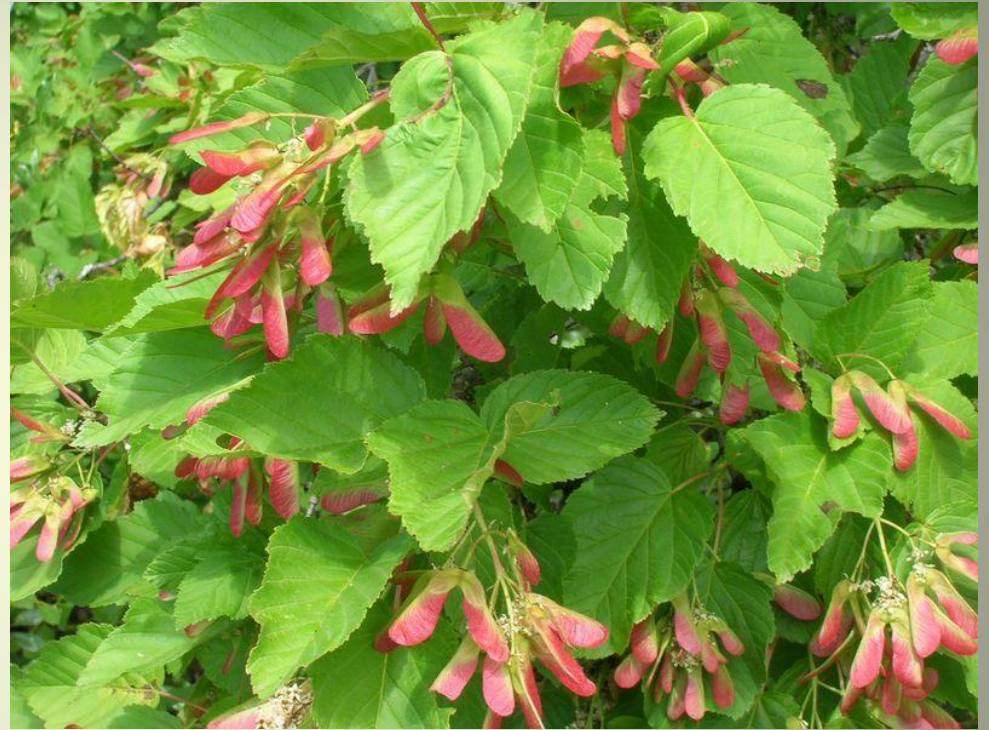
Клён татарский (с овальными листьями)