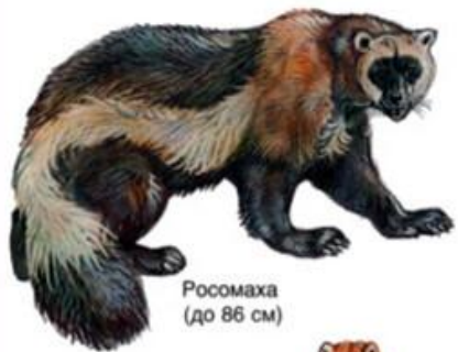
Росомаха (до 86 см)