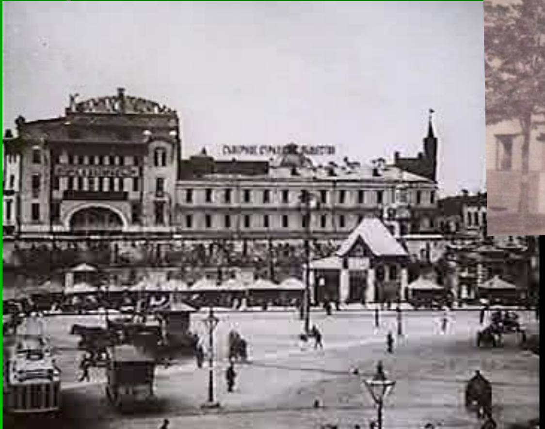
Московский дом писателя