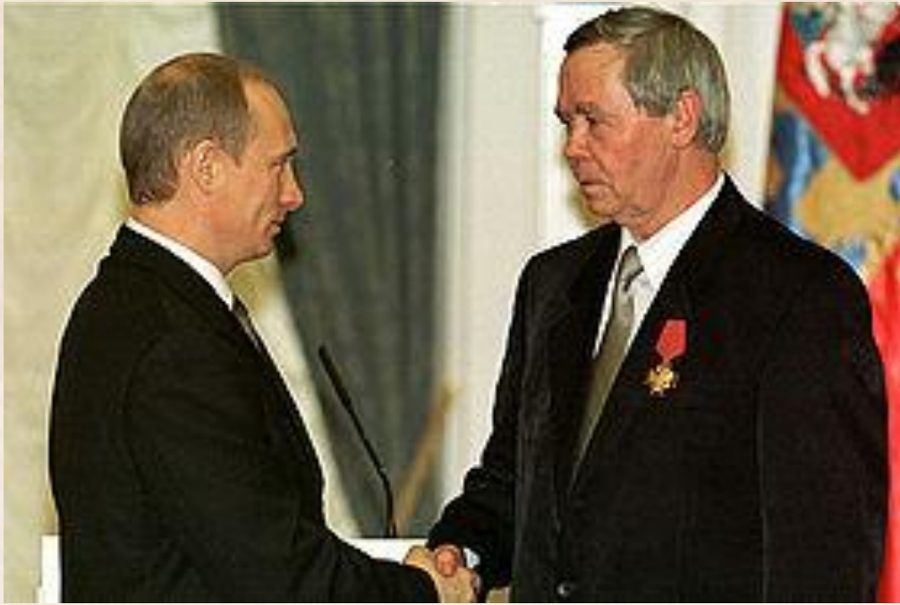
Валентин Распутин и Владимир Путин

Валентин Распутин тратил немало сил и времени на защиту Байкала, воевал с ненавистными ему либералами. Летом 2010-го его избирают членом Патриаршего совета по культуре от Русской православной церкви.