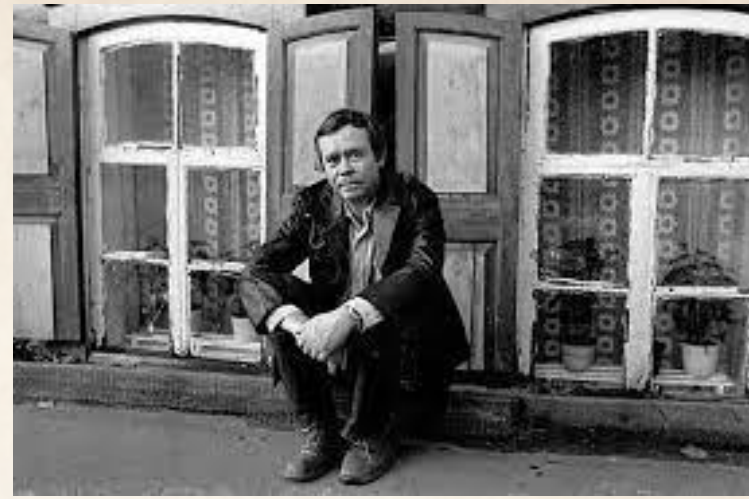
Валентин Распутин в деревне

Валентин Распутин повествует о том пронзительном горе и неизбывной тоске, которую испытывают коренные жители, старики, прощаясь с землёй и ветхой деревенькой, где знакомая и до боли родная каждая плевных призывов! Простая кочка, каждая колода на избувина.