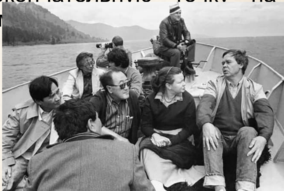
Валентин Распутин на Байкале с зарубежными писателями

вышла вторая повесть Валентина Распутина «Последний срок», которая принесла ему всемирную известность и была переведена на десятки языков. Многие