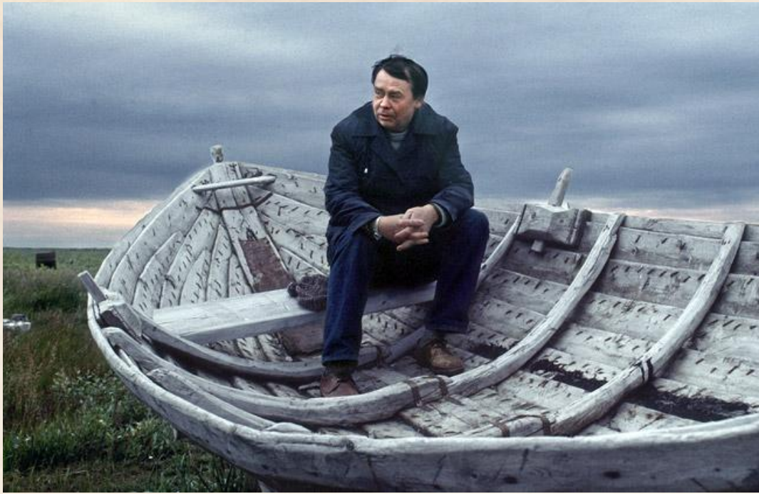
Валентин Распутин на лодке

Спустя 6 лет вышла повесть, которую многие считают визитной карточкой прозаика. Это произведение «Прощание с Матёрой». В нём рассказывается о деревне, которая скоро должна быть затоплена водой из-за строительства крупной