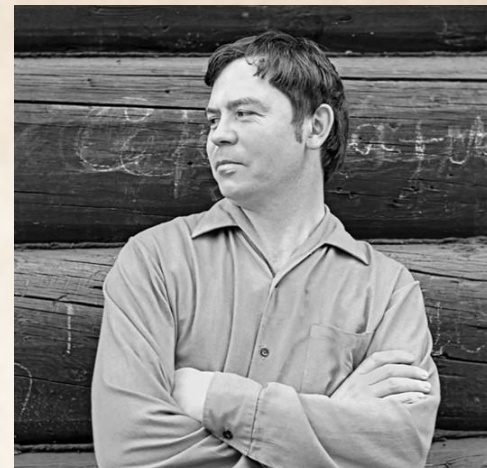
Валентин Распутин в молодости

Учиться Валентину Распутину пришлось в посёлке Усть-Уда, за полсотни километров от деревни, где он жил. В Аталанке имелась только начальная школа. В будущем писатель отобразил свою жизнь этого сложного периода в замечательном романе «Уроки французского». Иркутский университет, выбрав филологический факультет. Там Валентин Распутин увлёкся удивительно талантливыми и гениальными писателями Хемингуэем и Прустом. Парень старался не только блестяще учиться, но и помогать семье, маме. Он подрабатывал, где только мог. Именно тогда Распутин начал писать. Сначала