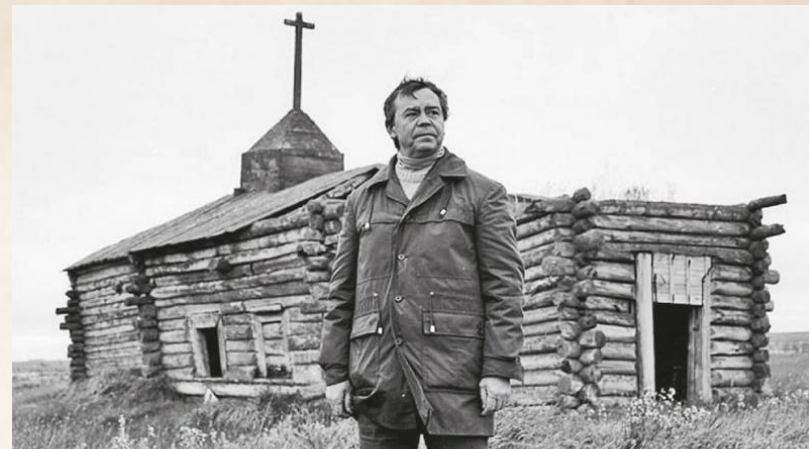
Валентин Распутин в деревне