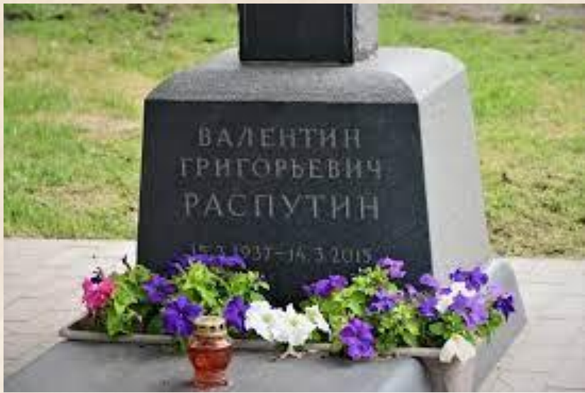
Могила Валентина Распутина

Но по времени того места, где он родился, смерть пришла в день его рождения, который в Сибири и считают настоящим днём кончины великого земляка.