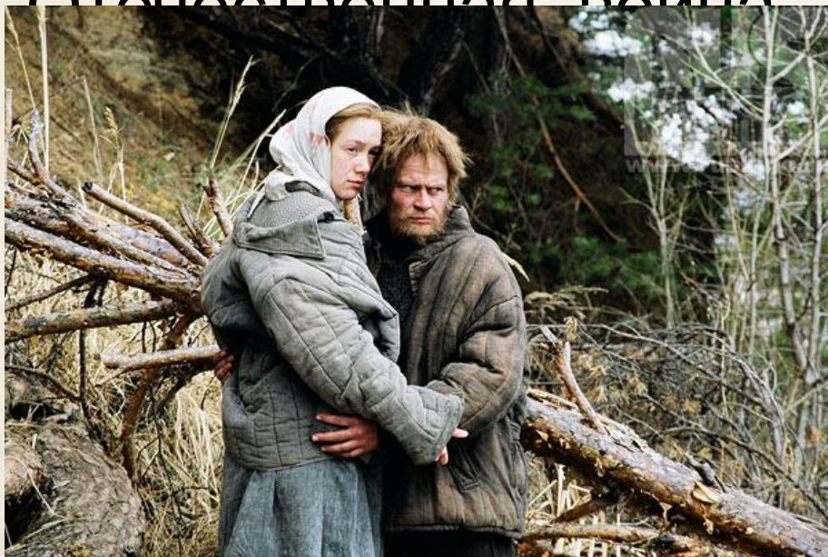
Кадр из фильма «Живи и помни» по повести Валентина Распутина

Знаковым оказался для литератора 1977 год. За повесть «Живи и помни» его наградили Государственной премией СССР. Это произведение о человечности и той трагедии, которую принесла стране Великая