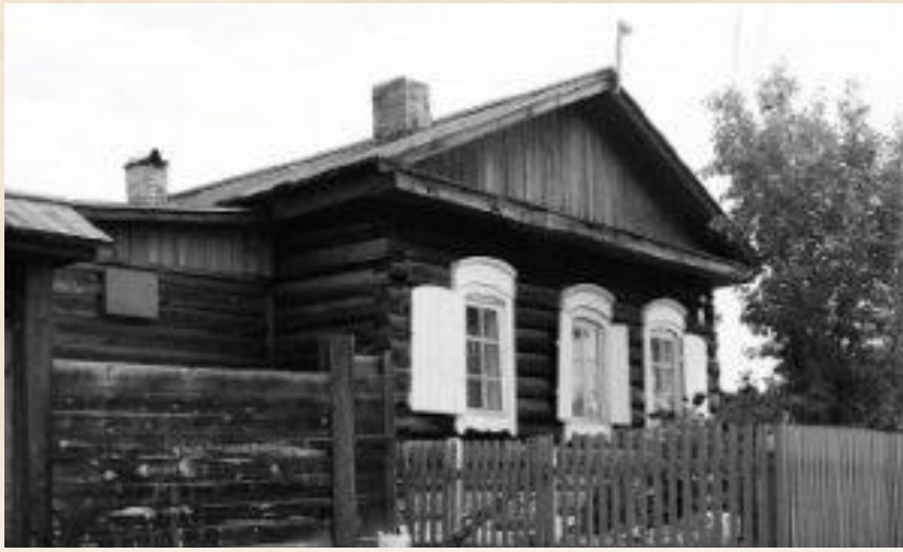
Дом в Аталанке, где прошло детство писателя

Мальчик рос удивительно смыслённым и пытливым. Он читал всё, что попадалось в его руки: обрывки газет, журналы, книги, которые можно было раздобыть в библиотеке или в домах односельчан. После возвращения с фронта отца в жизни семьи, как казалось, всё наладилось. Мама работала в сберкассе, отец, герой-фронтовик, стал заведующим почтовым отделением. Беда пришла откуда-то откуда её никто не ждал. украли сумку с казёнными деньгами. Заведующего судили и отправили отбывать срок на Колыму. Трое детей остались на попечении матери. Для семьи начались суровые, подуглоподные годы.