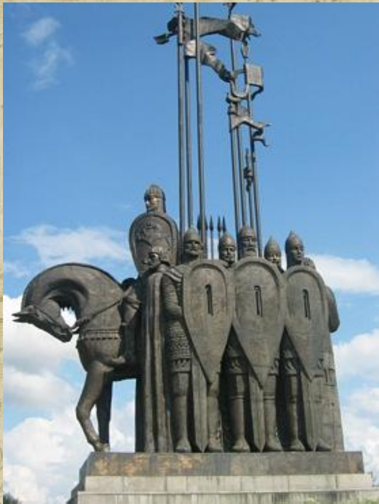
Памятник А.Невскому и его дружине на горе Соколиха