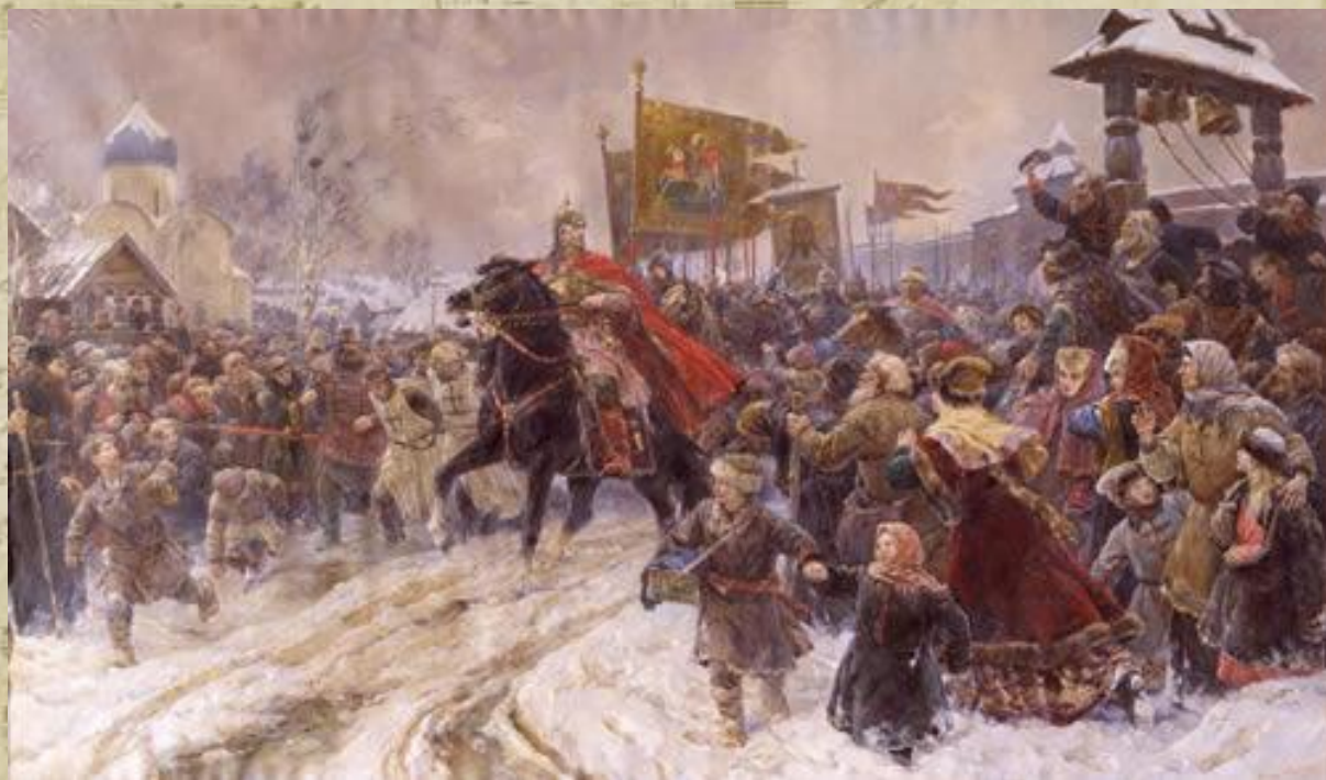
В.Серов «Въезд Александра Невского в Псков после Ледового побоища»