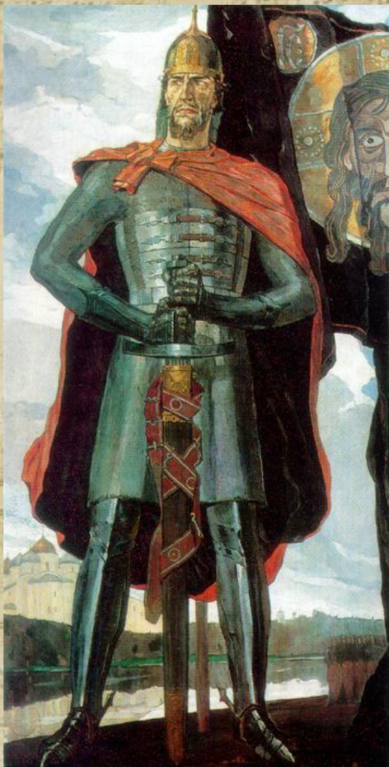
П.Корин «Александр Невский»