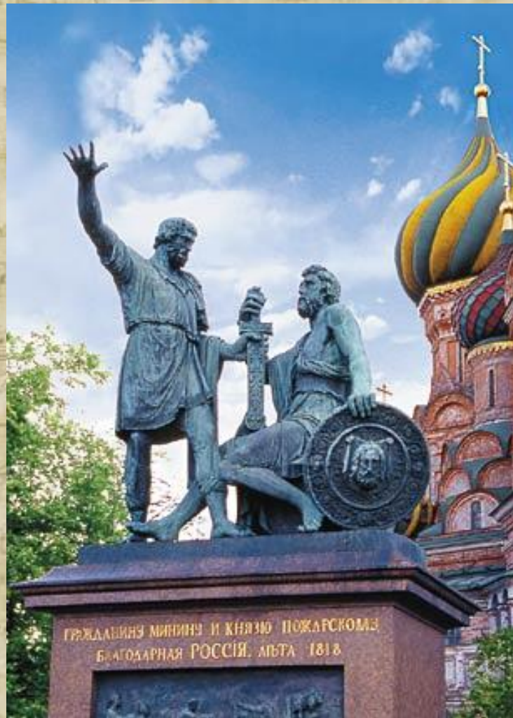
Памятник гражданину К.Минину и князю Д.Пожарскому